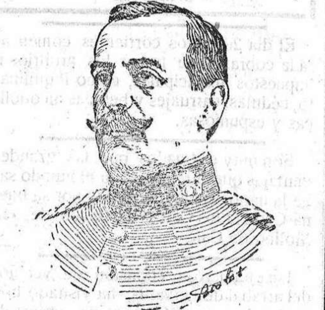
El general Villalva que dirigió la ocupación de Zinat y demás posiciones.

La ocupación de Zinat es tal vez la acción de mayor importancia militar y política de todas las verificadas en aquel territorio, pues será de aquí en adelante un punto estratégico para posteriores operaciones que han de realizarse en los territorios de Anyera y Wad-Rás.