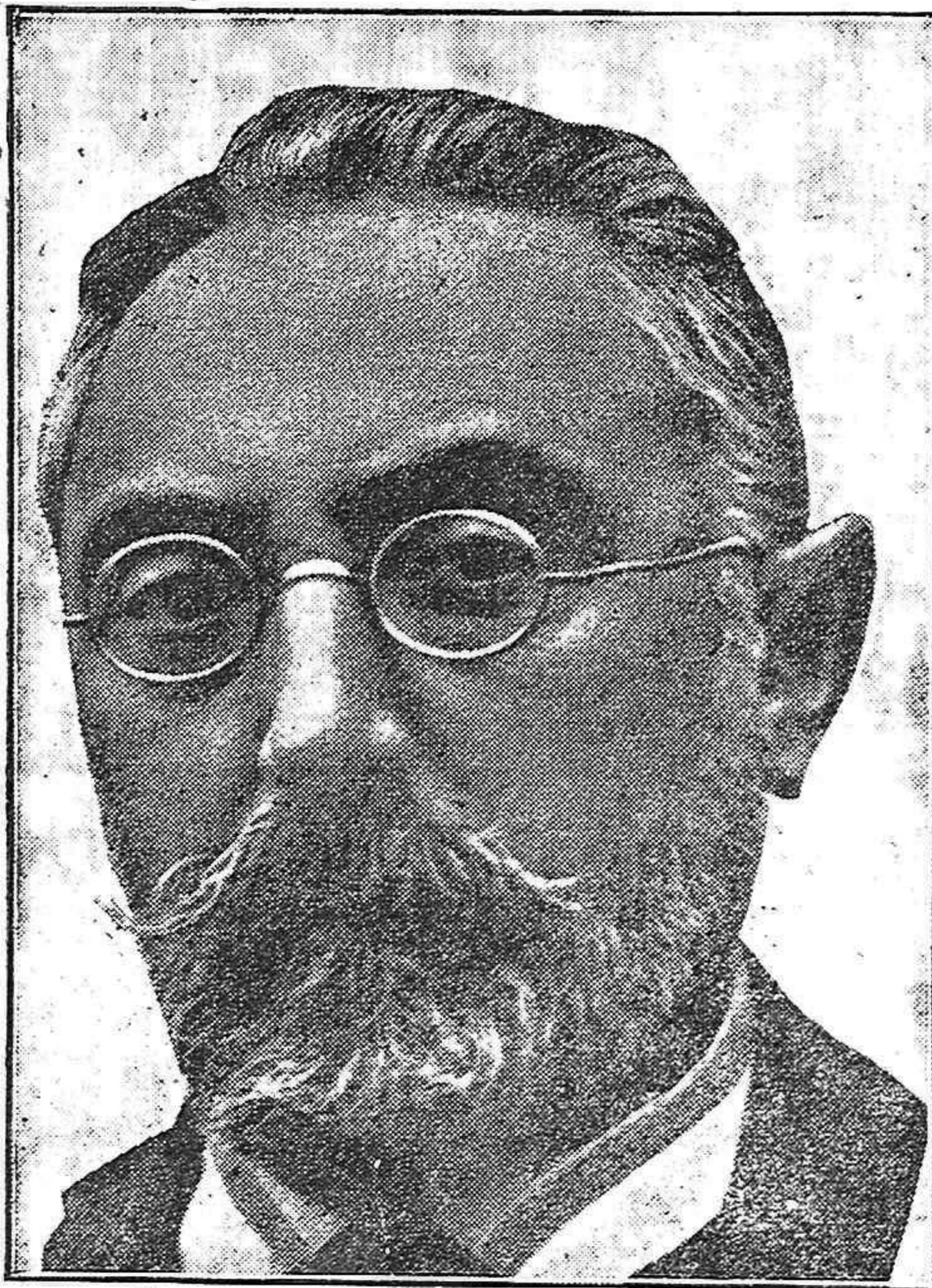
El ilustre rector de la Universidad de Salamanca, D. Miguel de Unamuno, que ha sido nombrado Ciudadano de Honor en el cuarto aniversario de la proclamación de la República