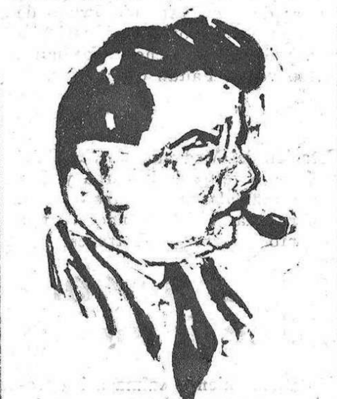
EDUARDO HERRIOT, jefe del socialismo radical, triunfante en las elecciones francesas, para diputados