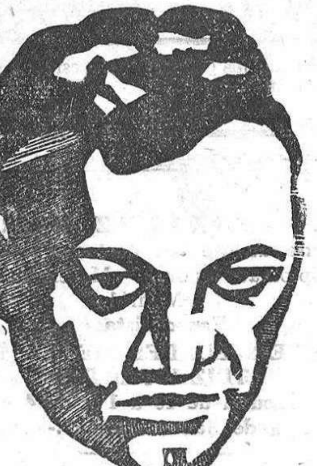
Gustavo Deloor, belga, que el pasado año fué ganador absoluto de la Vuelta.