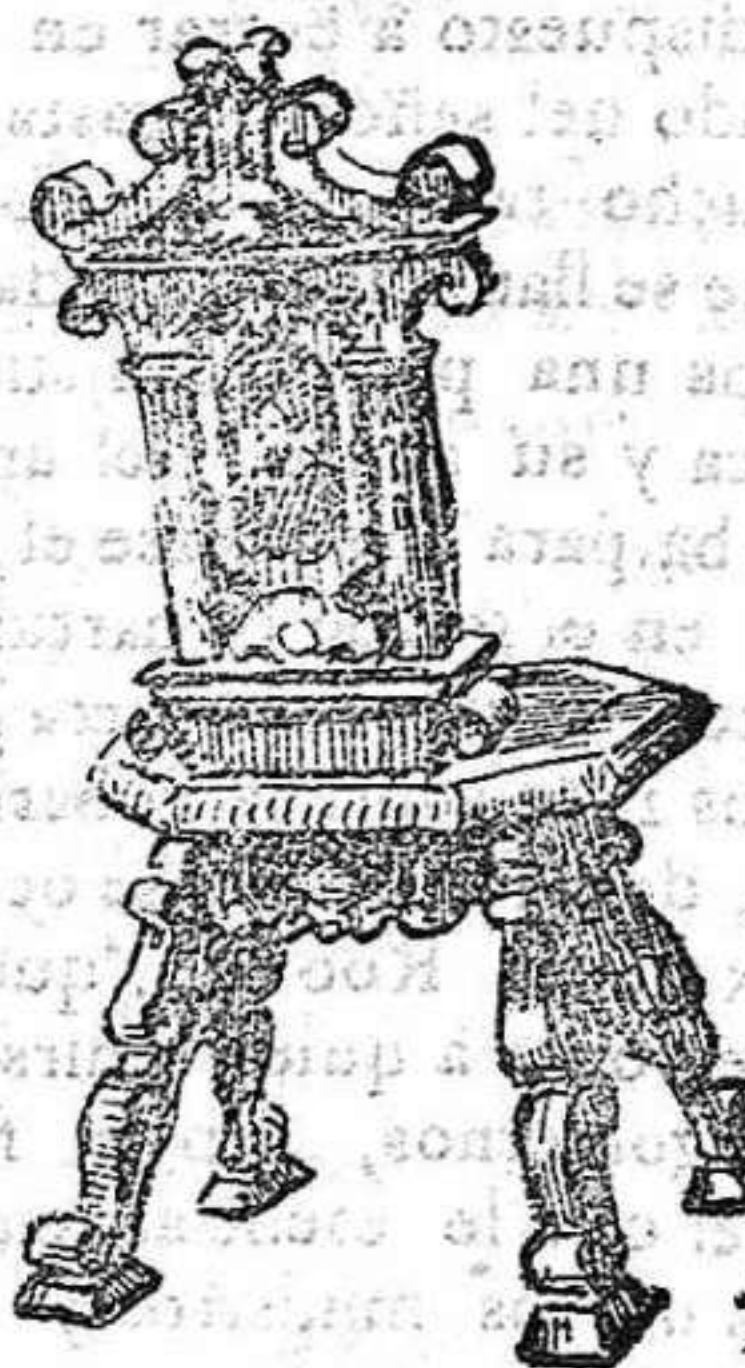
SILLA SIGLO XVI

La silla cuyo grabado publicamos figuró en la exposición de arte retrospectivo celebrada en París en 1865.