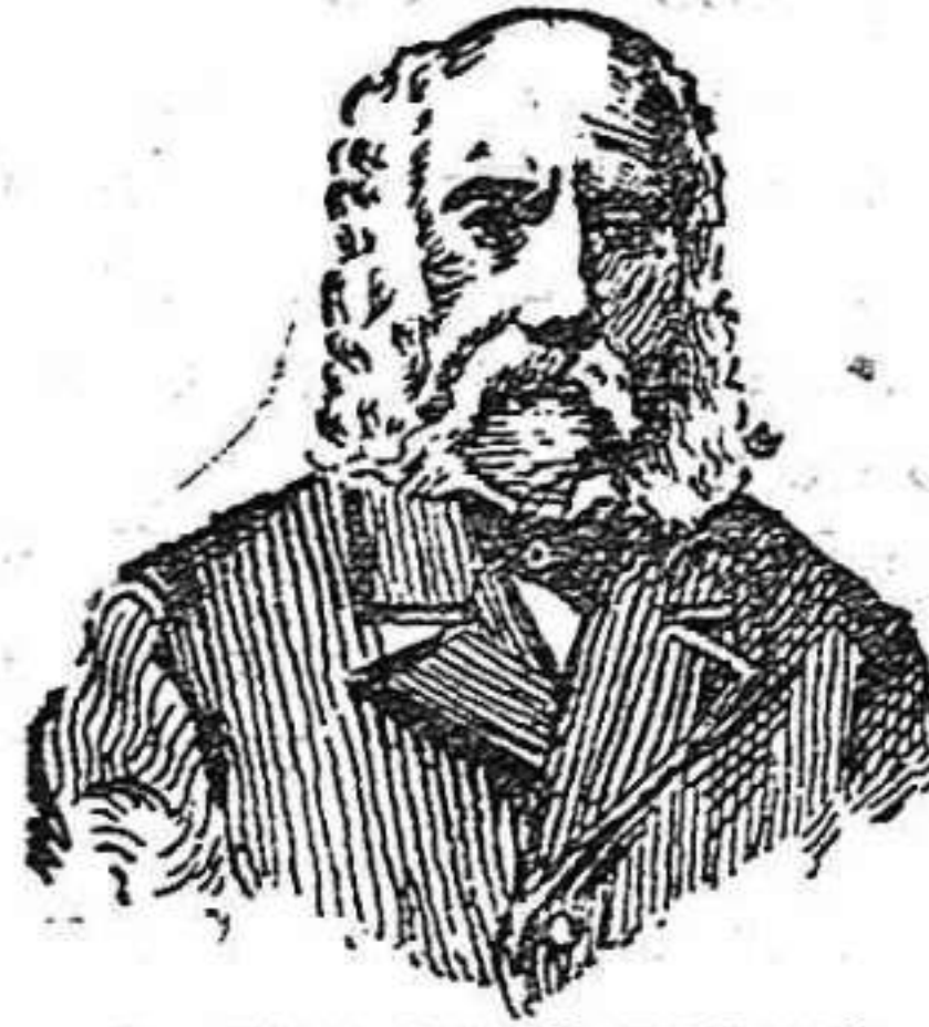
A. Charles Lambert. Paris. Depósito general

Calle Aragón 40, Barcelona. Por fin llegó á España la especialidad única en su género del eminente doctor Monsieur A. Charles Lambert, de Paris. Dicha celebridad analizando una infinidad de hierbas medicinales de la India, y después de profundos estudios, llegó á obtener el completo resultado que mediante una cuidadosa combinación de dichas hierbas pudo obtener un maravilloso específico, que en muy pocos días cura radicalmente cualquiera purgación crónica ó catarro de la vejiga ó restricción uretral etc.