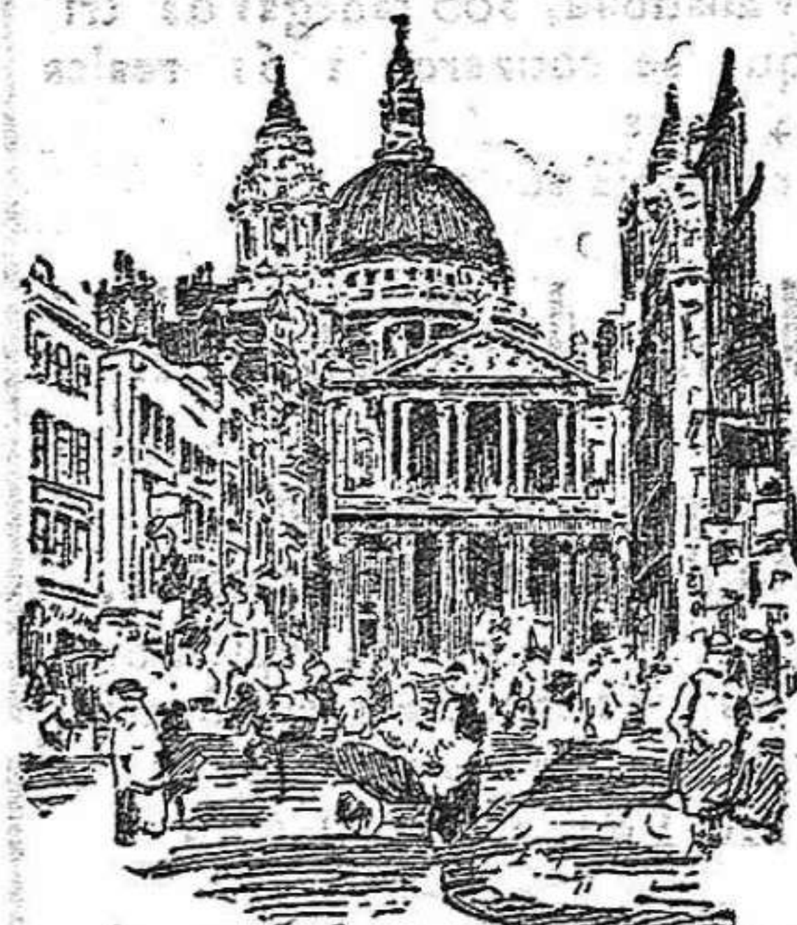
La Catedral de San Pablo.

La catedral de San Pablo, que después de la abadía de Westminster es el más importante monumento religioso de Londres, es muy digna de estimación, no obstante ser un mediocre remedo de la basílica de San Pedro, de Roma, a la que gana en esbeltez. Alzase en el