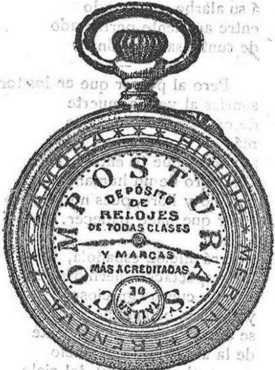
Relojes Mored, péndulos y Reguladores.