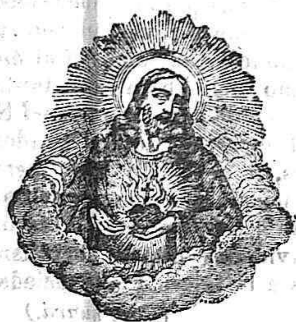
EL SACRADO CORAZÓN DE JESÚS ARBOL DE LA VIDA

Cada mes se celebrarán SEIS misas a intención de los suscriptores a EL ANCORÁ