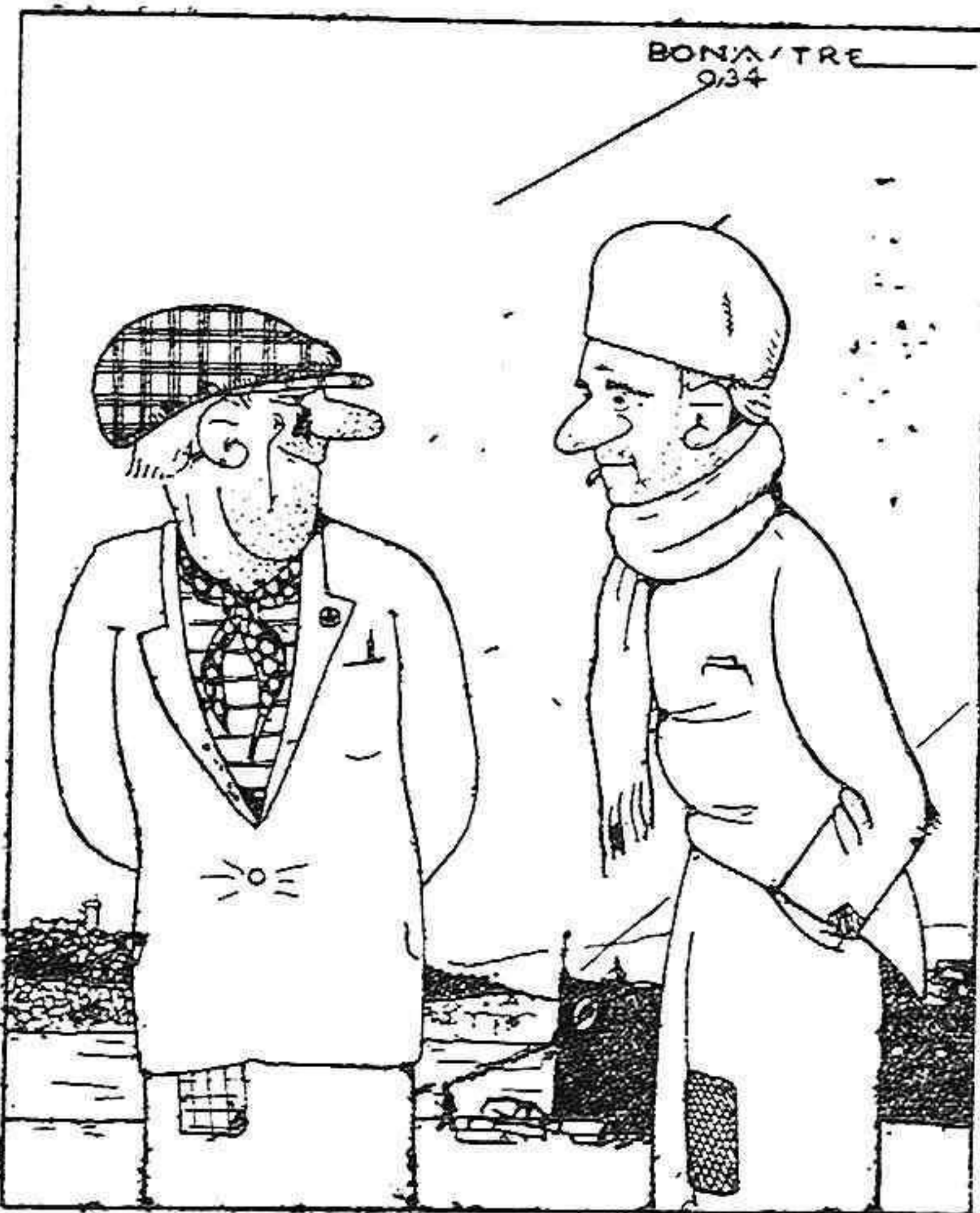
—A n'és camps de futbol només sónen es pitos? —No, are també sónen ets arbitrs.