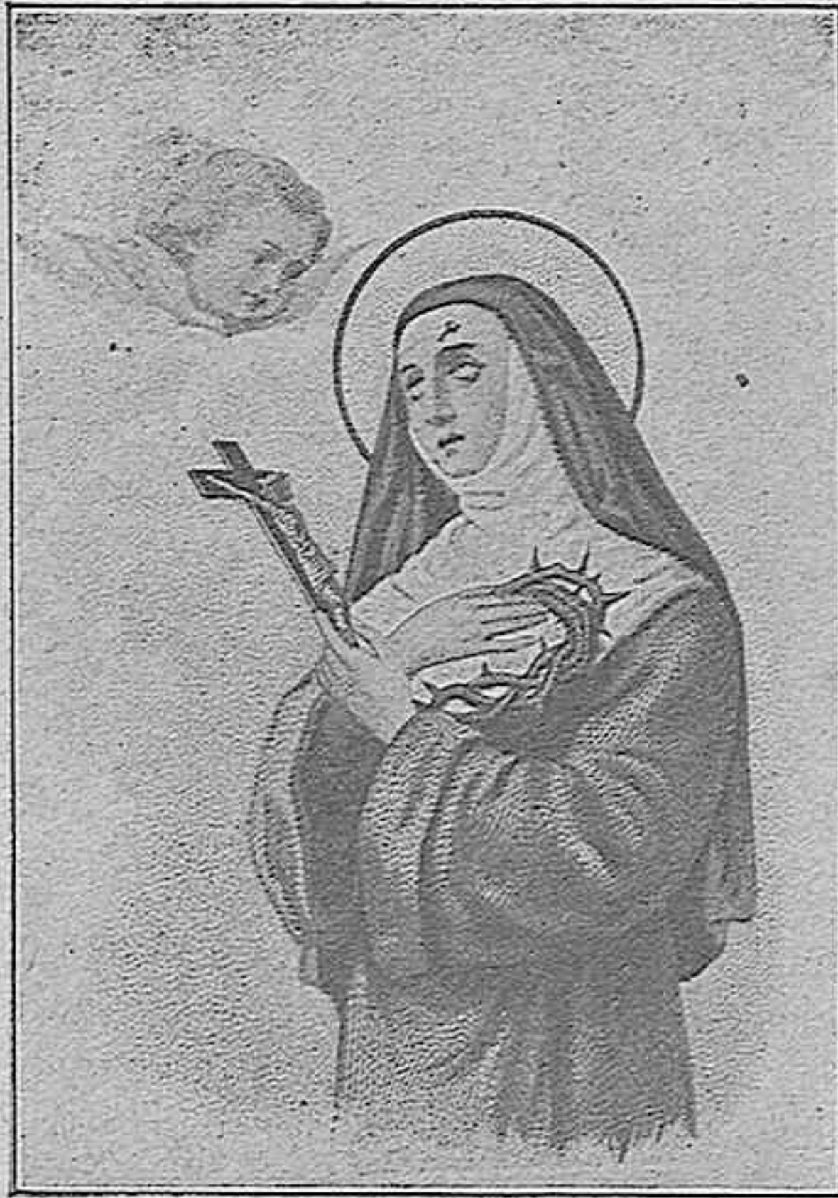
Santa Rita de Casia, abogada contra la viruela