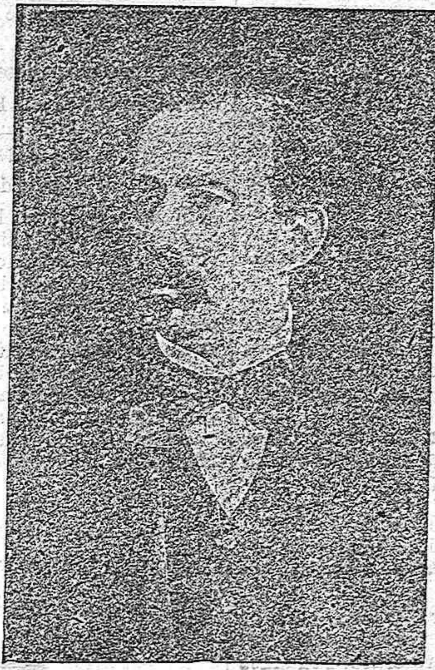
D. Manuel Ruiz Zorrilla

De que nuestras ideas van infiltrándose en el pueblo nos lo demuestran las simpatías que vamos adquiriendo y la proyección que nos dispensan cuantos desean con nosotros ver implantado el reinado de la Libertad y de la Justicia para paz y prosperidad del pueblo todo.