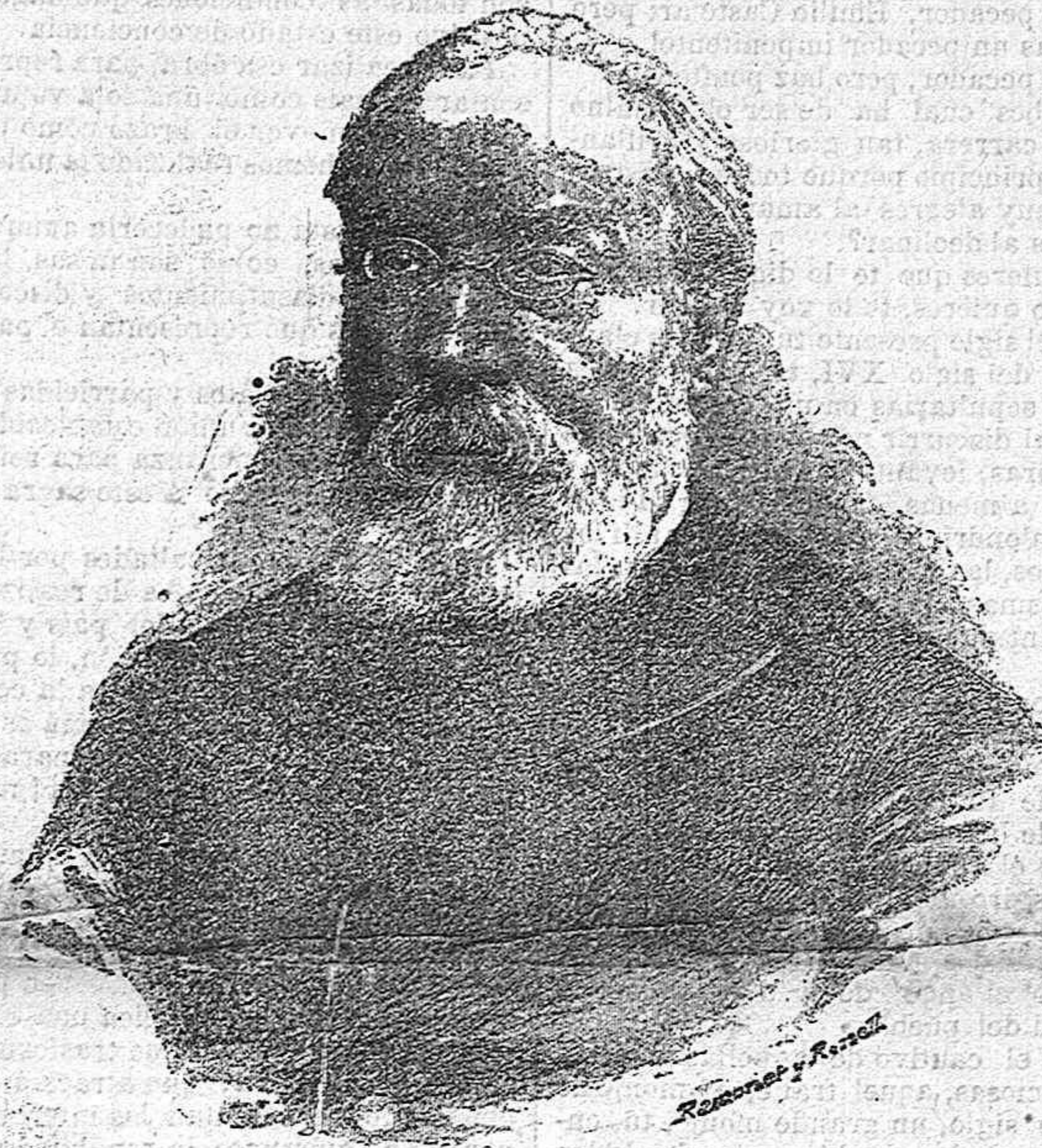
D. FRANCISO PI Y MARGALL

Indicaremos los males donde creamos verlos y procuraremos su remedio hasta donde podamos con la con-