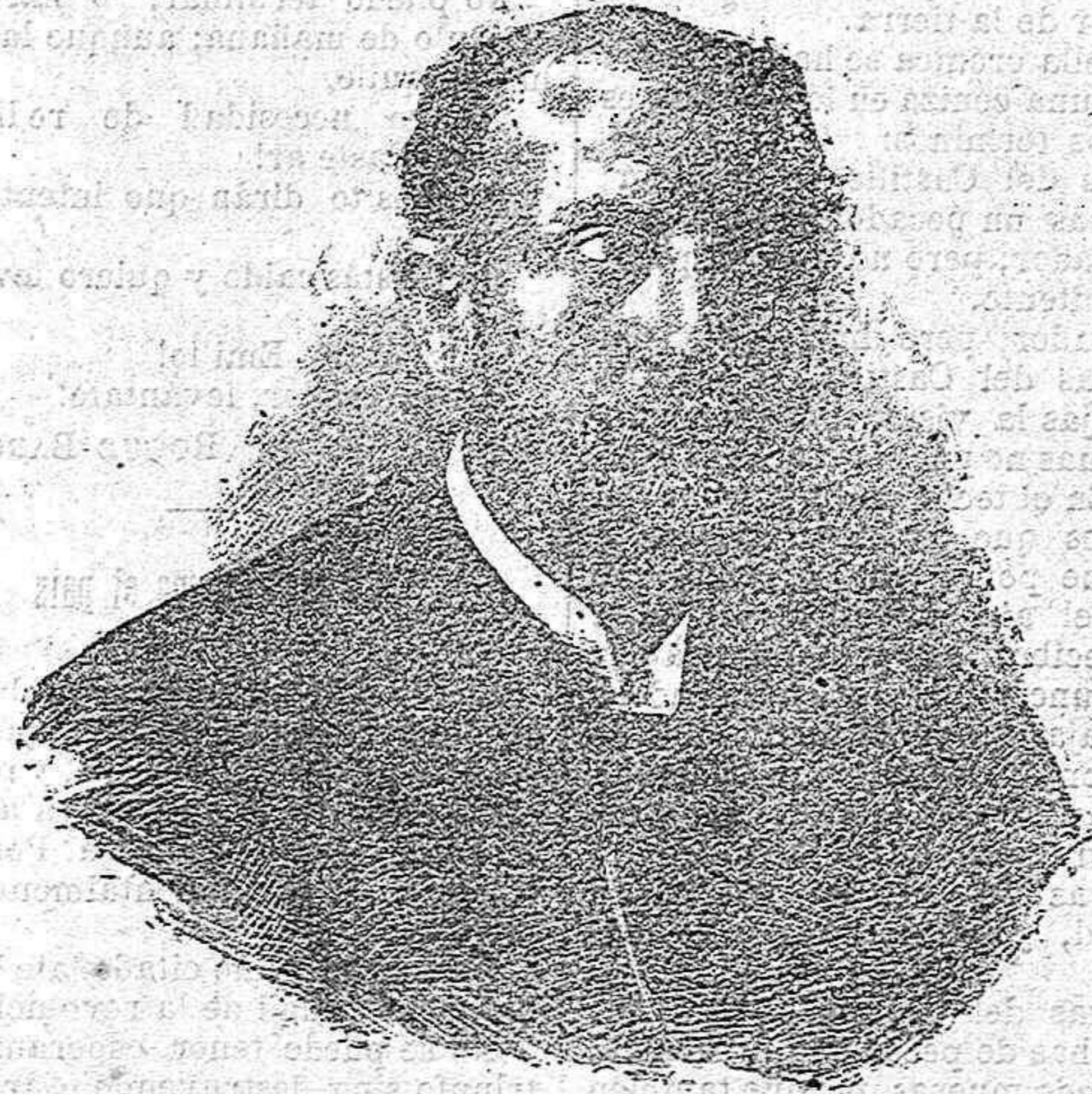
D. NICOLÁS SALMERÓN

Los sacrificios que nos hemos impuesto son muchos, y si antes de terminar la obra que la conceptuamos laboriosa, flaquearan nuestras fuerzas, por falta de necesario apoyo, quedaríamos siempre con la satisfacción de haberlo intentado.