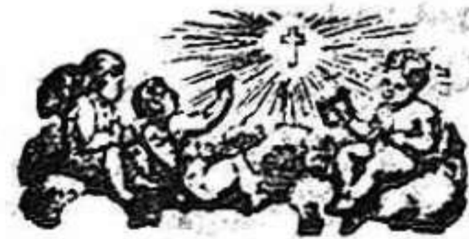
Santo de mañana.