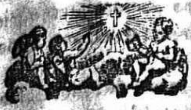
Santo de mañana.