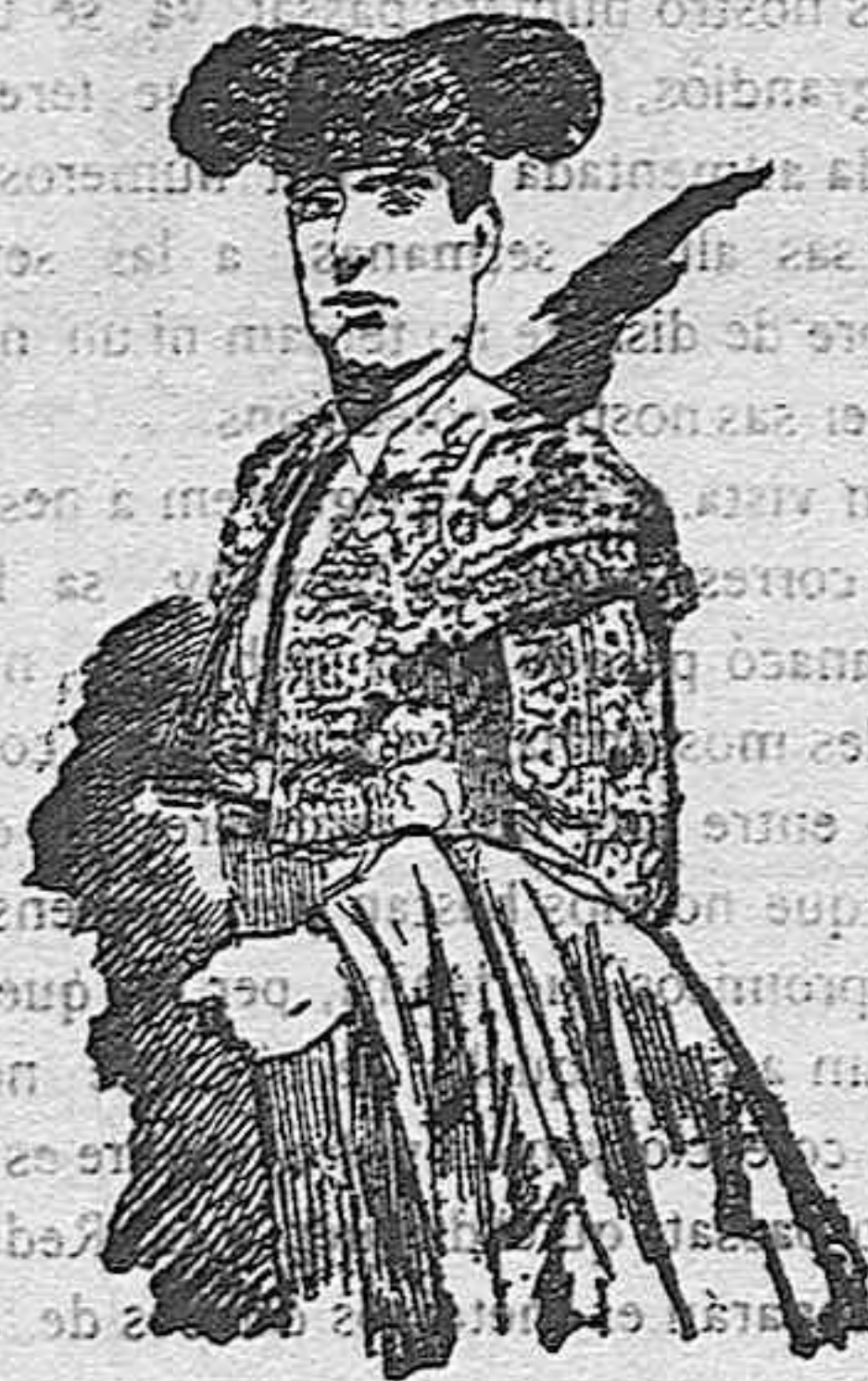
Es nostro Directó vestit de torero per cuant haja de clavá sas banderillas.