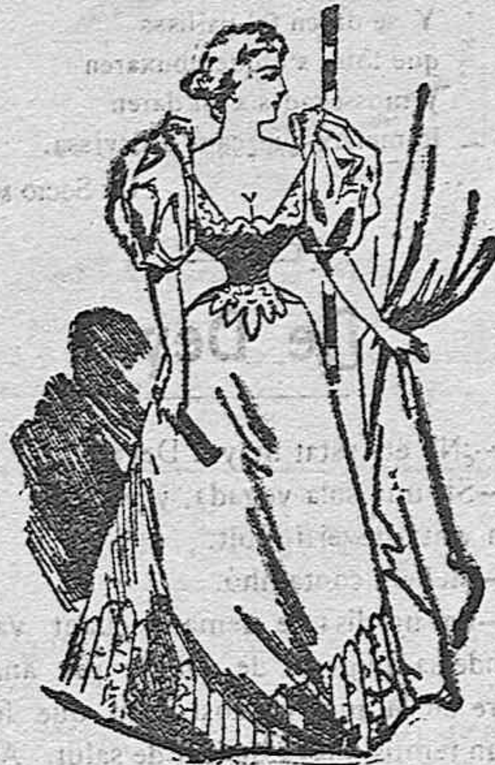
Vestit de senyoreta per s'estiu. Creassió xerri-mosa.