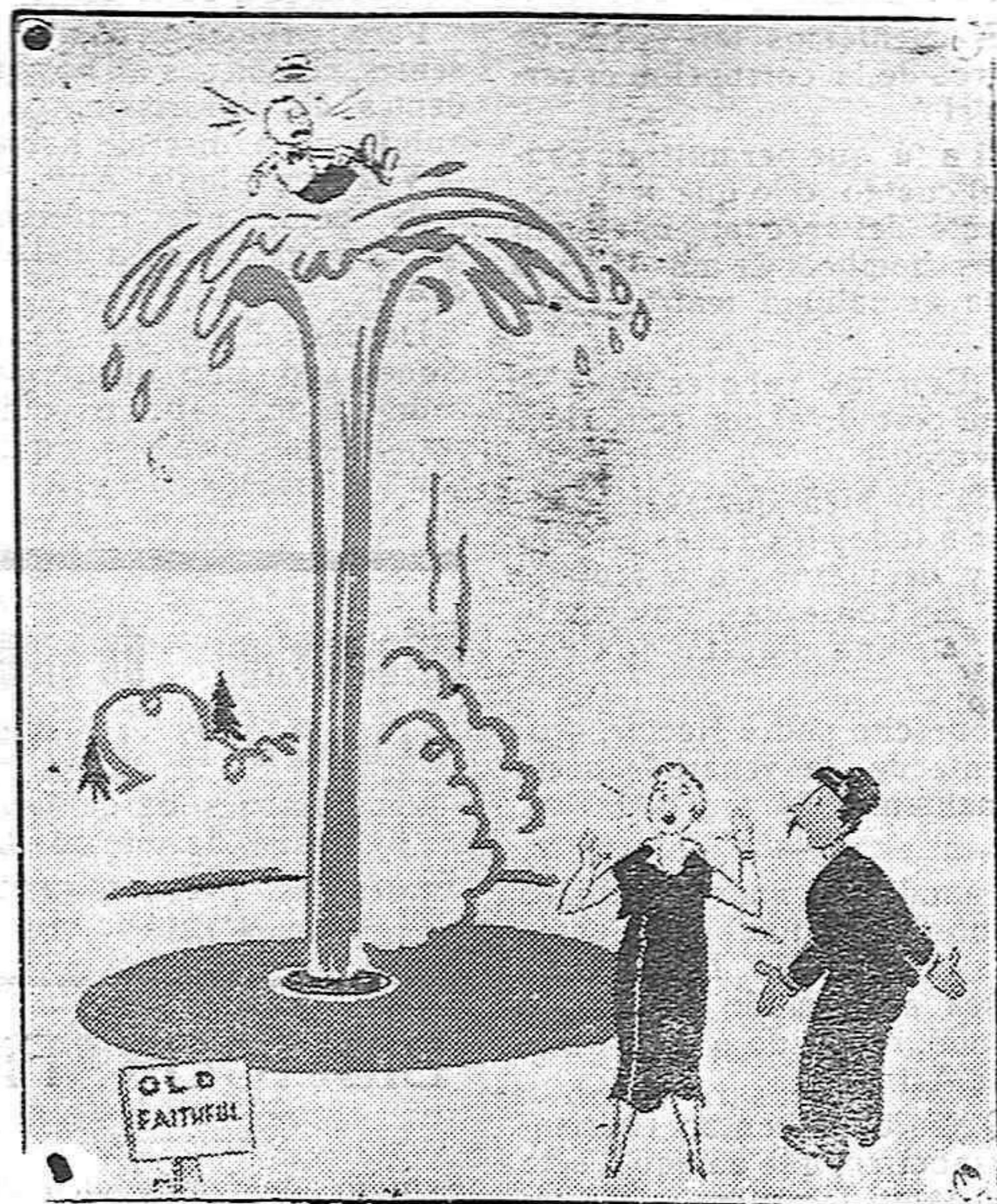
LOS JUEGOS DE AGUA