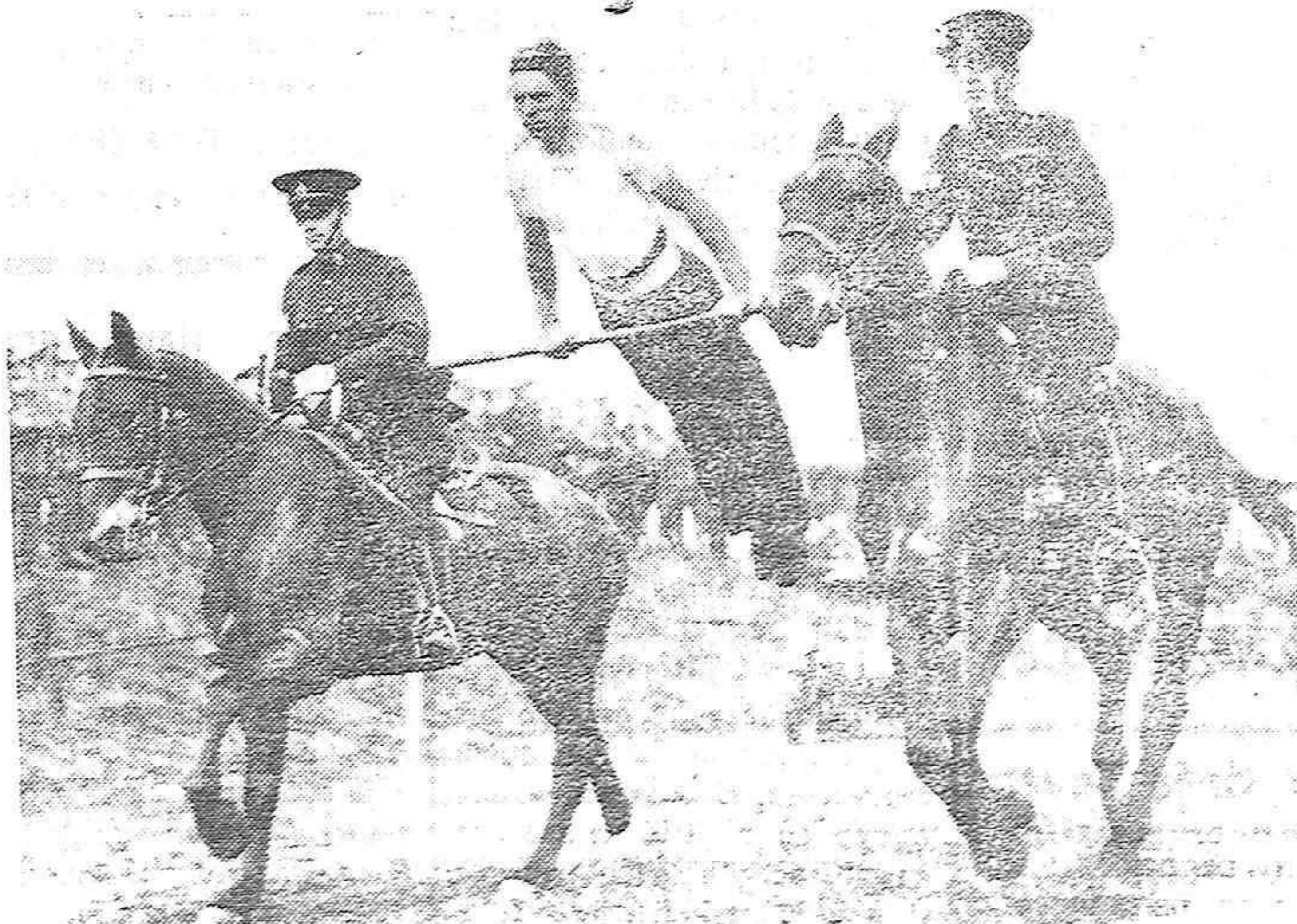
EL DEPORTE EN INGLATERRA

Ejercicios de barra realizados entre dos caballos al trote.