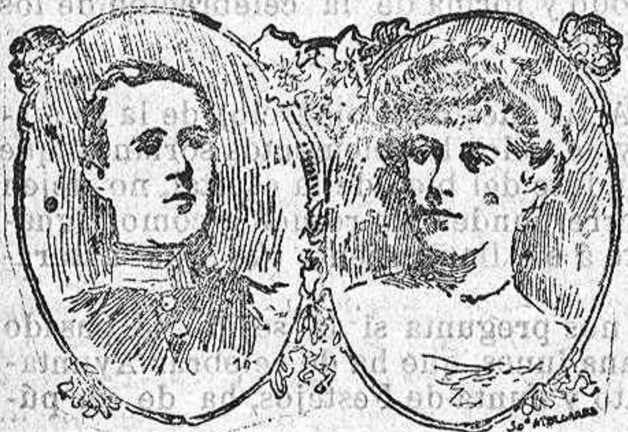
Graham y Lady Hamilton.

El marqués de Graham era un inglés feliz; poseía juventud, linajejo ablenjo,