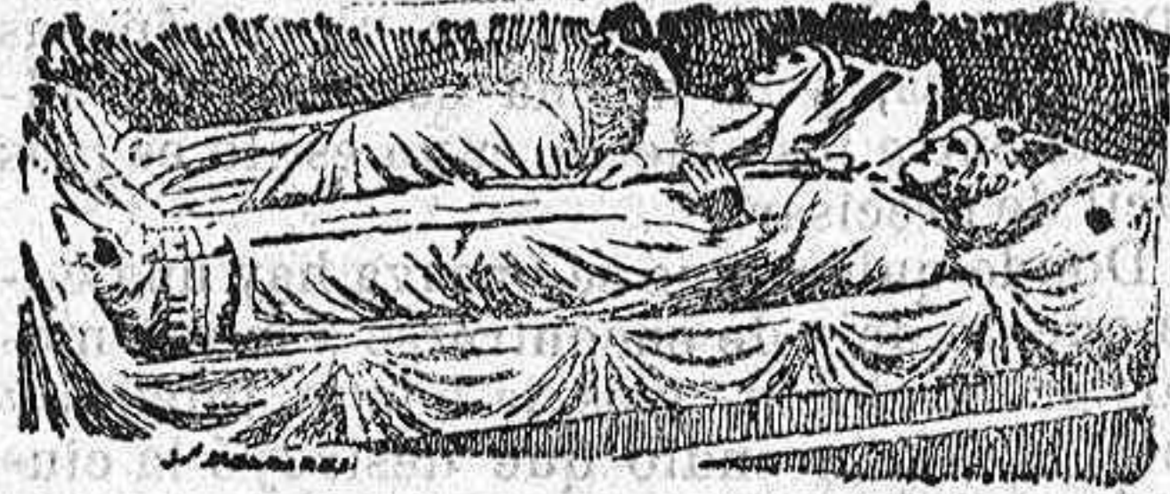
Los reyes Plantagenet.

citando la entrega de sus reyes, y por sus buenas relaciones con Francia, ha concluido por conseguir lo que deseaba.