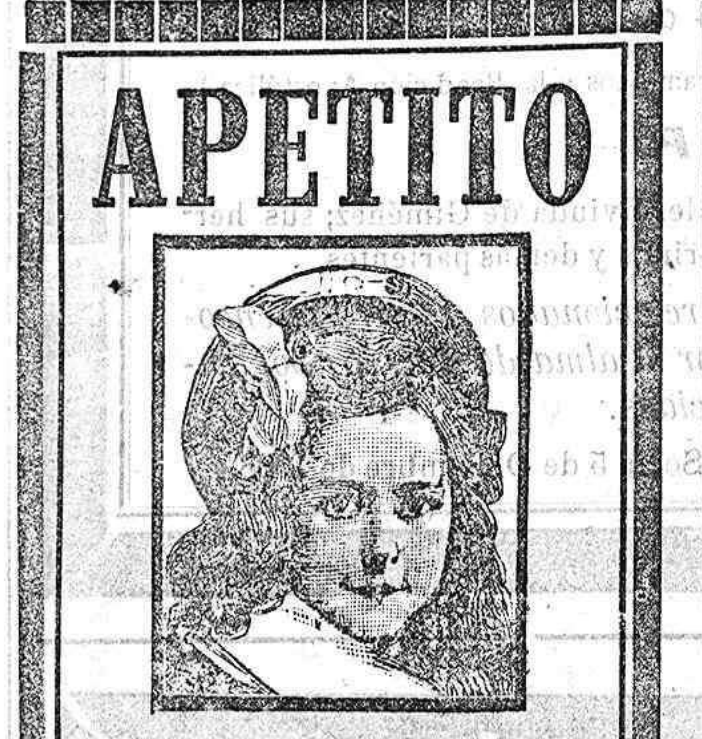
Huesca, Coto alto 58, 10 Enero 1908.

Sea cual fuere la utilidad de este libro, la cedemos toda en obsequio de nuestros paisanos, nada queremos reservar para nosotros como no sea la satisfacción de haberla ellos acogido con benevolencia»