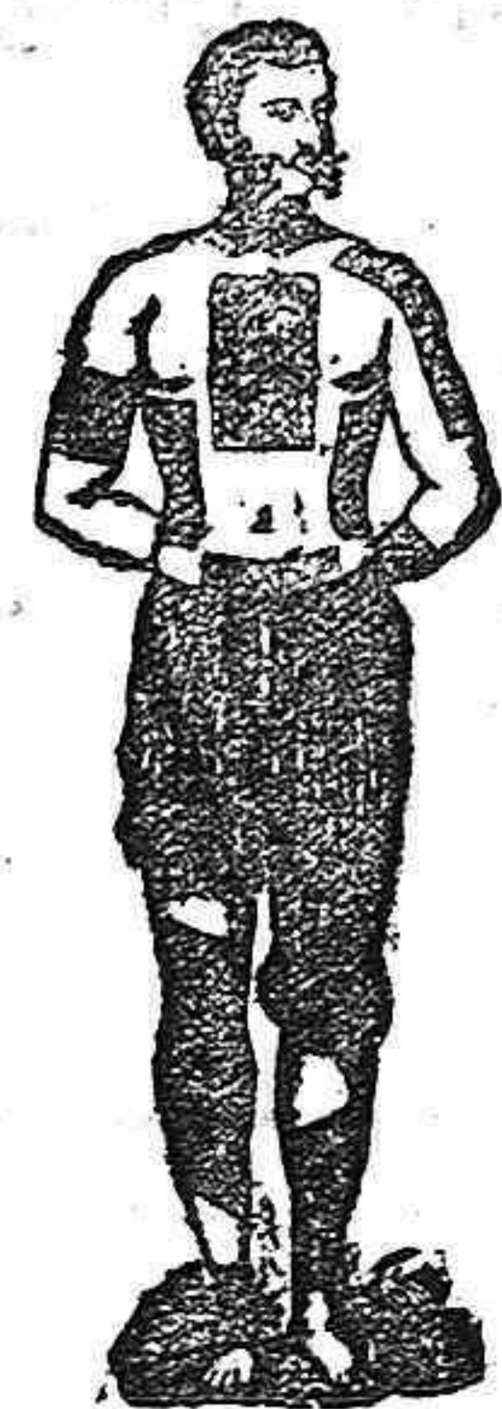
Trade Mark Registered. Los emplastos de feltro rojo, del Dr. Winter, son los únicos verdaderos y eficaces. Cuidado con las imitaciones. Exíjase siempre la marca del Dr. Winter. Cura como por encanto. Boticas y Droguerías.

LLOPIS Emplastos Perforados Americanos de Feltro rojo ó sea bayeta encarnada del Doctor WINTER