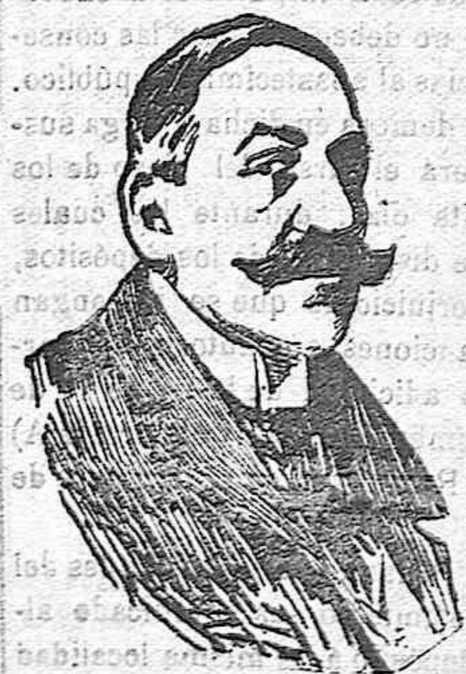
M. Klotz, ministro de Hacienda, francés, y delegado en las Conferencias de la paz.