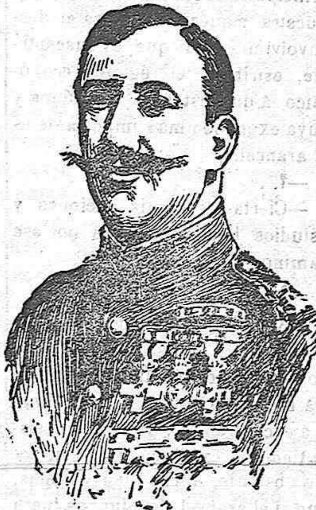
El exministro de la Guerra general don Dámaso Berenguer que ha sido nombrado Alto Comisario General de España en Marruecos.