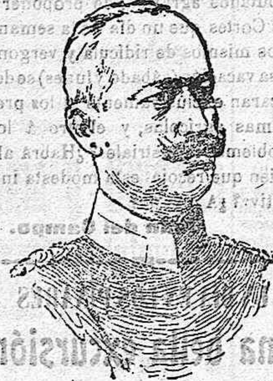
El general alemán Ludendorff que ha sido relevado del cargo de jefe del Estado Mayor.