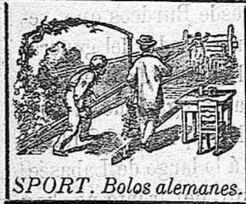
SPORT. Bolos alemanes.

En este establecimiento encontrarán la rica leche de la ganadería de Valdeavellano de Tera.