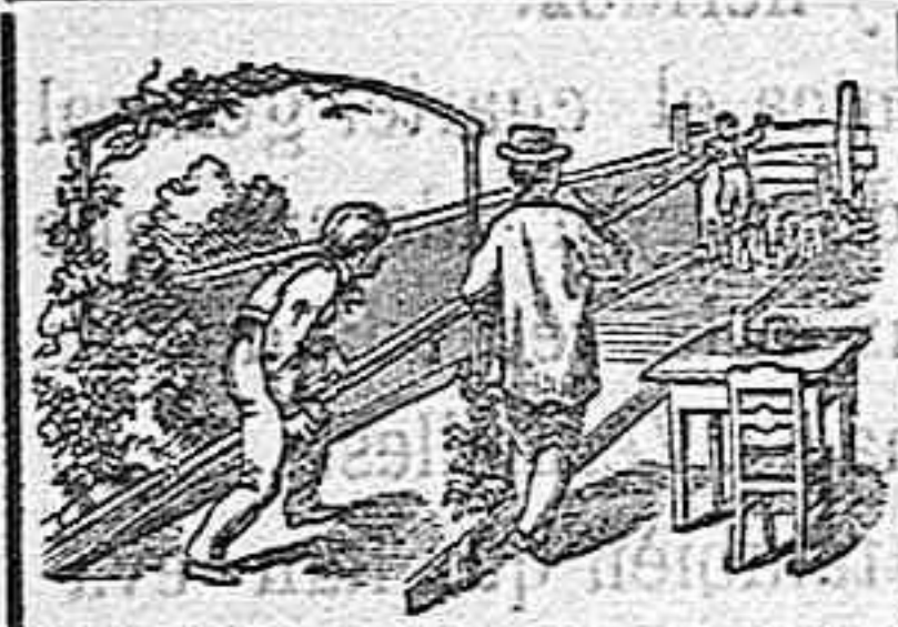
SPORT. Bolos alemanes.

En este establecimiento encontrarán la rica leche de la ganadería de Valdeavellano de Tera.