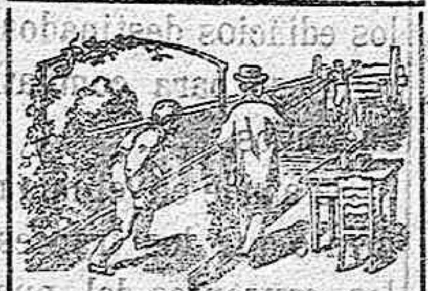
SPORT. Bolos alemanes.