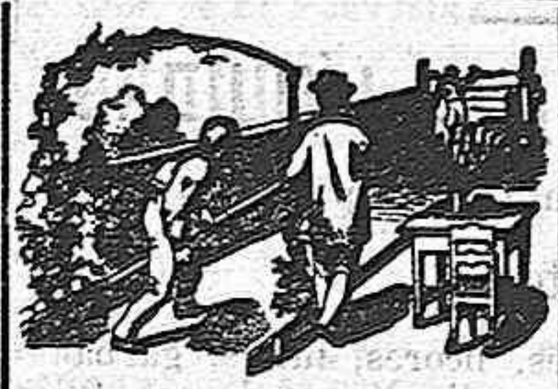
SPORT. Bolos alemanes.