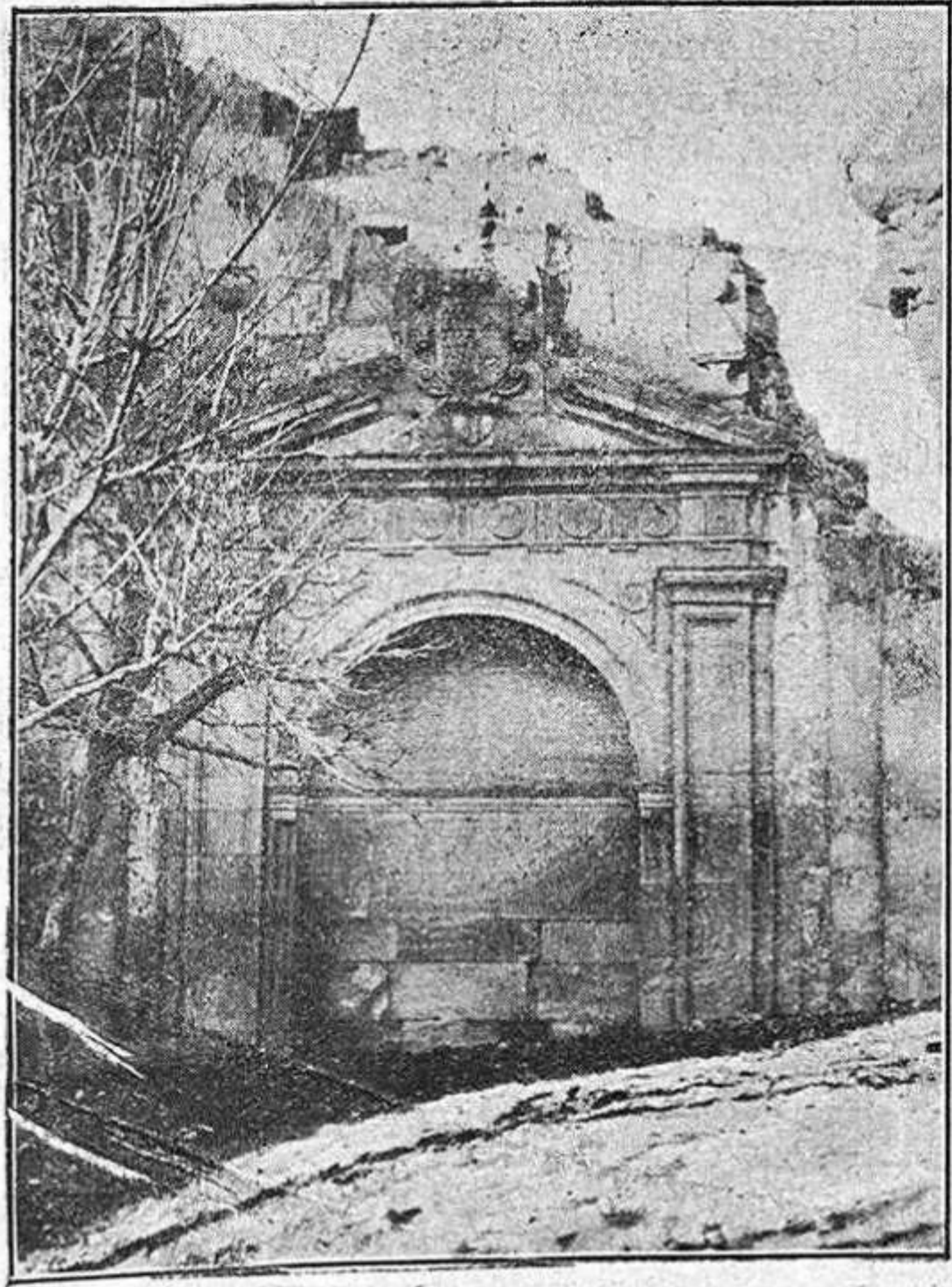
Panteón de los Veras

Según Loperraez, el año 1618 se quemó todo el convento primitivo excepto la iglesia y una parte de la casa conventual que caía á la huerta. «Reedificándose muy luego, con bastante suntuosidad, por la piedad de los fieles». Las dos espaciosas alas del edificio, muy transformadas, donde hoy día se aloja el Hospital de Santa Isabel, pueden dar ligera idea de lo que fué el antiguo monasterio, del que todavía se conserva en el interior, tal como estaba, la tendida y amplia escalera principal.