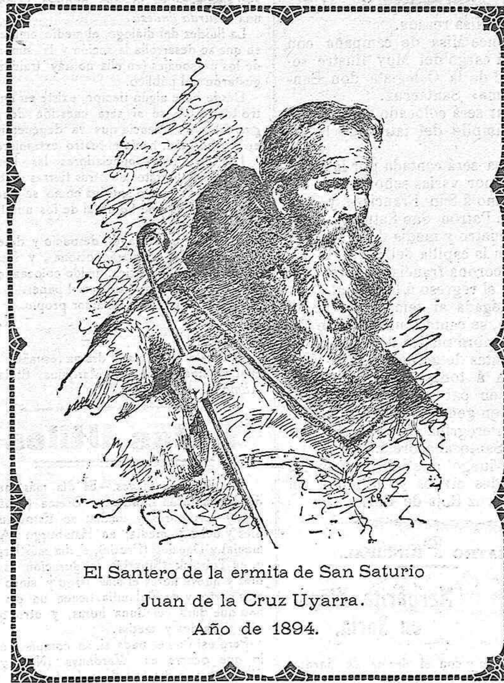
El Santero de la ermita de San Saturio