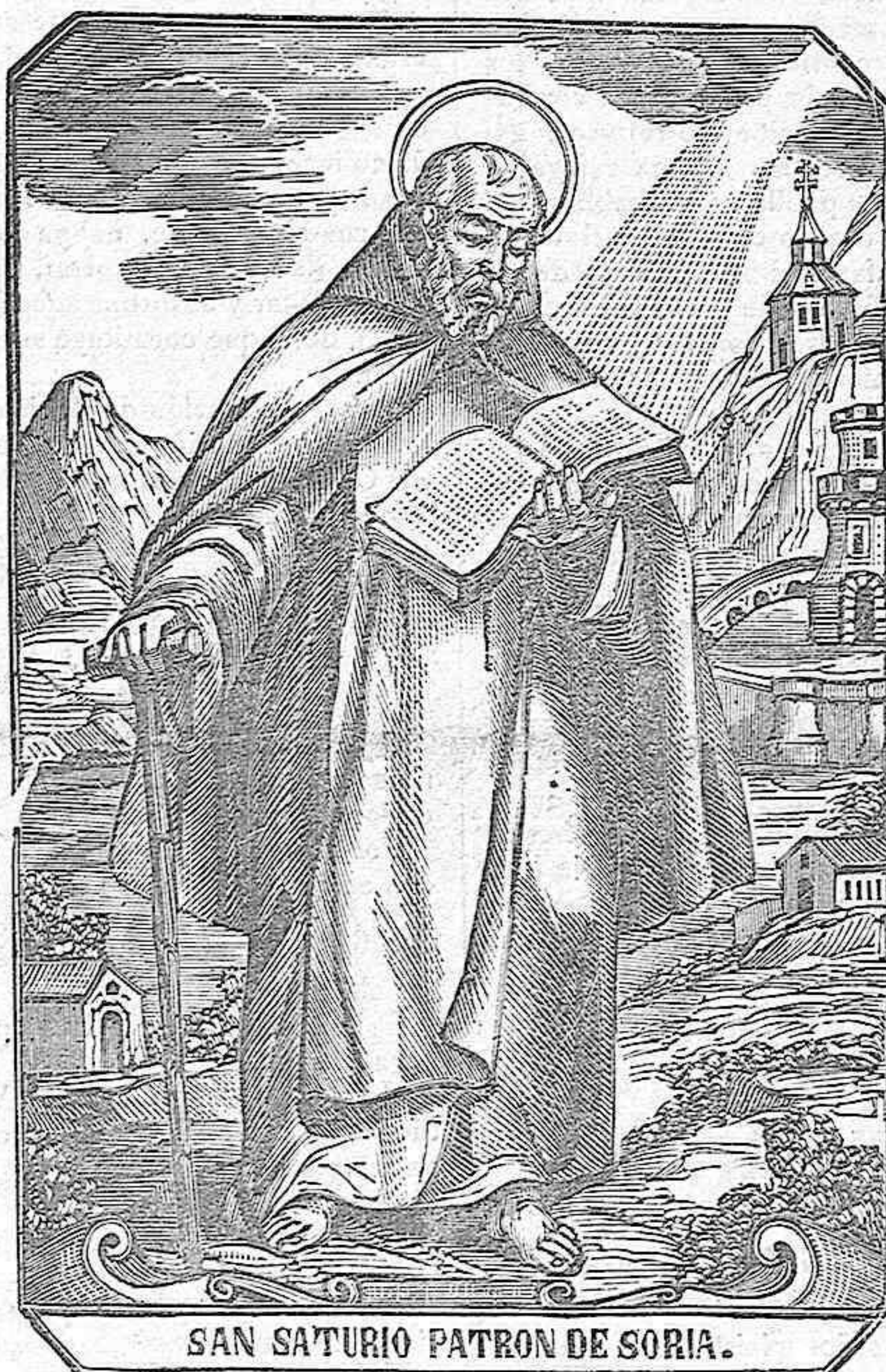
SAN SATURIO PATRON DE SORIA.

Del pueblo que te adora, y fervoroso en tus altares ruega; es tu imagen gloriosa, la joya más preciada y valiosa