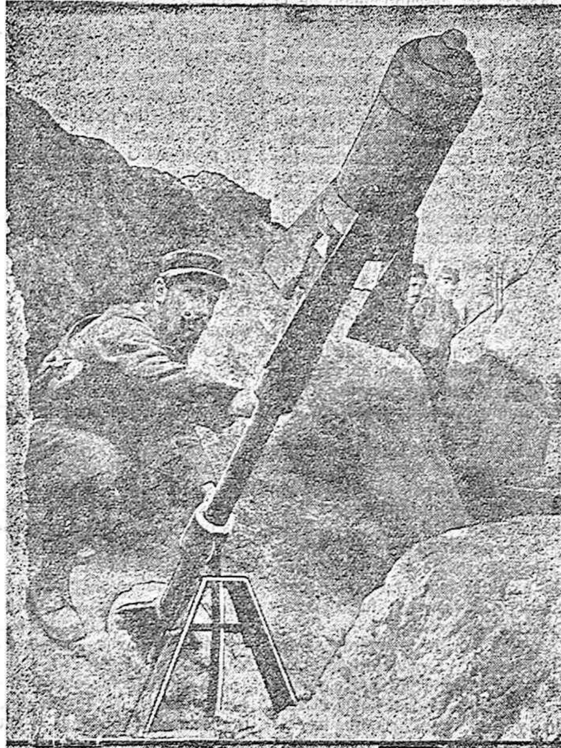
SOLDADO FRANCÉS DISPARANDO UN CAÑÓN CON PROYECTILES DE ALETAS.

exigen el respeto a las reglas. Declaramos que no hay espectáculo, no hay tragedia en que todos los actores,—desde el toro hasta el espectador,—se hallen unidos como en esta por un lazo tan íntimo... y tan serio. El sol cumple también con su deber; y mejor que radie. Tiende sobre el ancho círculo de la plaza un soberbio dodecaedro azul; brilla en los alambres de los toreros, en las mantillas blancas, en los abanicos multicolores, en la sangre recién vertida... Fiesta de sol, no puede soportarse a la luz pálida y fría de los focos eléctricos. La arena, que por la tarde abrasa, debe de resbalar al llegar la luna como el lecho de un río. ¡Tantas cosas faltarán, faltando el sol! Sobre todo, el entusiasmo contagioso que justifica, o por lo menos explica la gran barbarie.