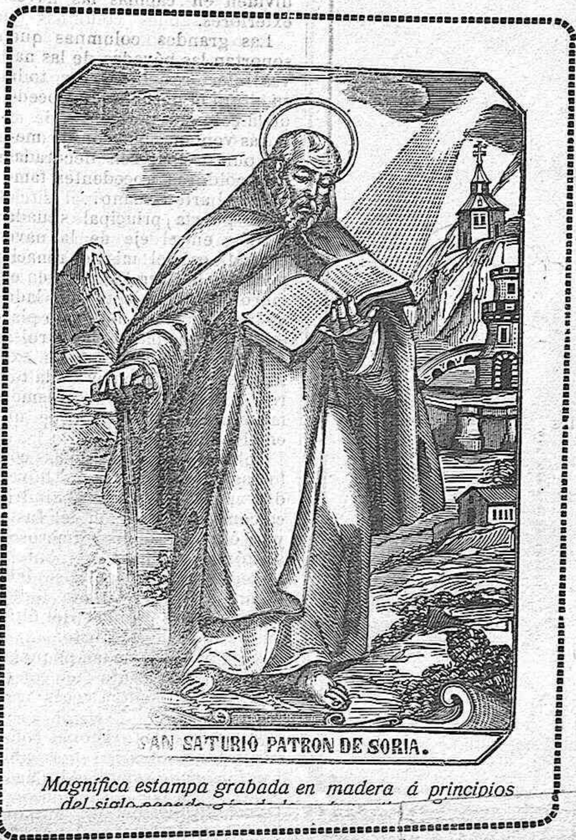
Magnífica estampa grabada en madera á principios del siglo pasado.