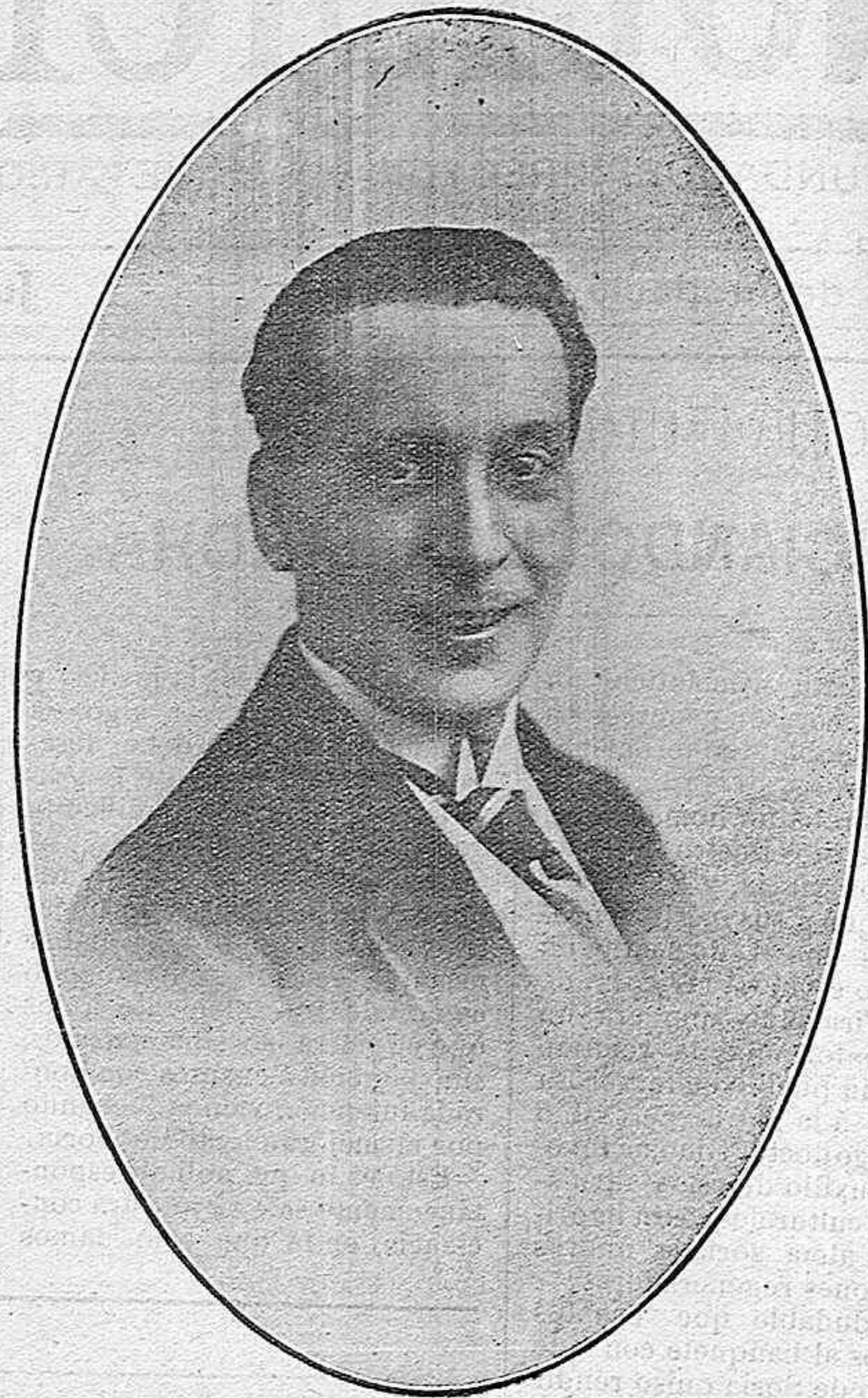
El notable primer actor MANUEL GONZALEZ