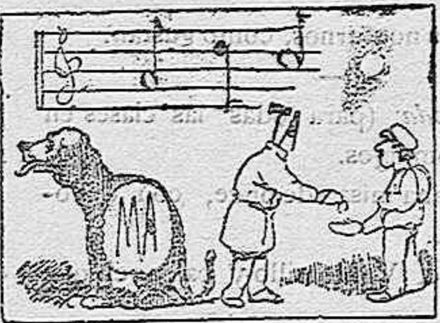
Fuga de consonantes.

o. a. e. i. o. a. a. o. ue. a. e. o. e. i. a. i. e. a. a. e. o. i. a. e. u. a. o. e. a. e. o. o. e. u. e. e. a. a. o.