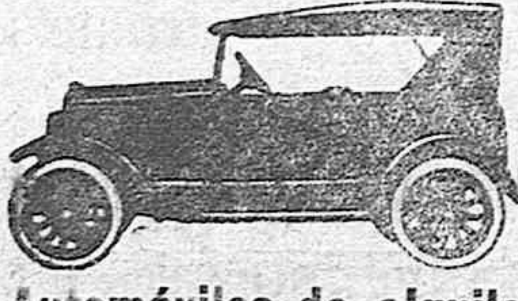
Automóviles de alquiler

Había la creencia de que si el monarca era el legítimo sucesor del trono, la piedra permanecía silenciosa; pero si se trataba de un pretendiente o un usurpador, la piedra lanzaba bramidos tan fuertes como los del trueno. La piedra del Destino está actualmente y lo ha estado durante siglos en la abadía de Westminster, donde como hemos dicho, sirve para las coronaciones.