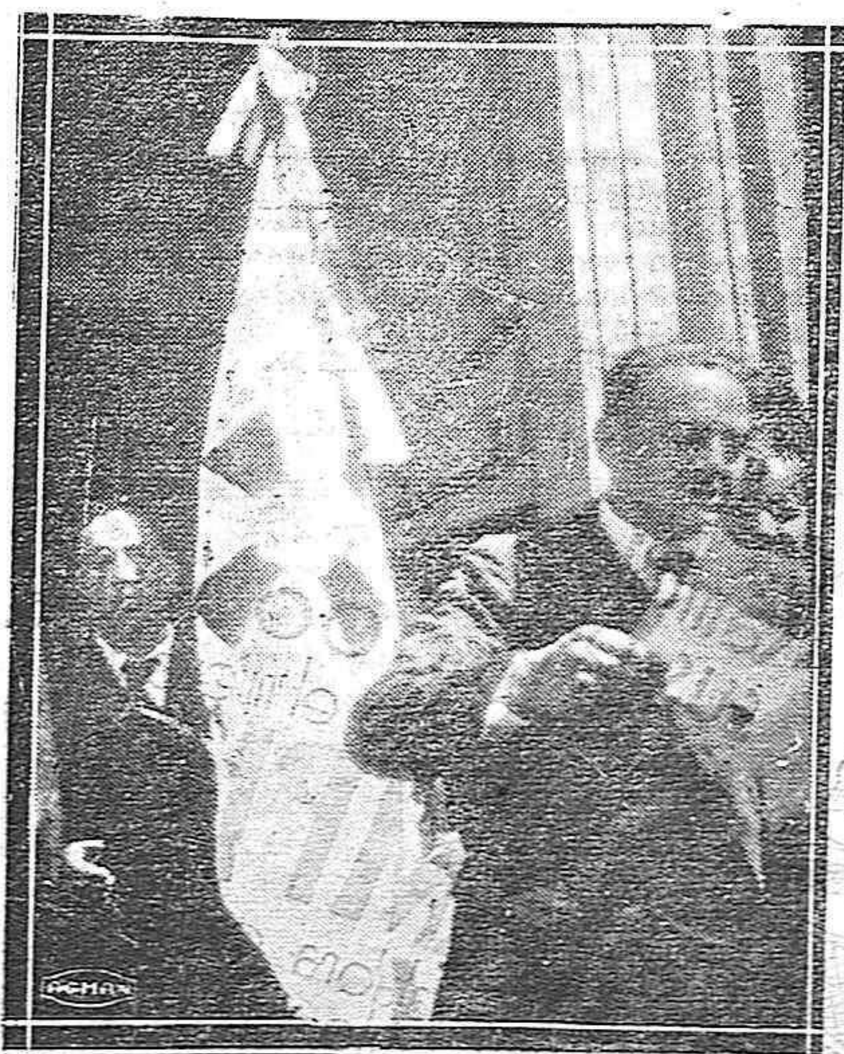
LAS JUVENTUDES CATOLICAS SALDAÑA.--El abanderado de la Juventud Católica Saldañesa, leyendo su discurso en el solemne acto celebrado el pasado domingo