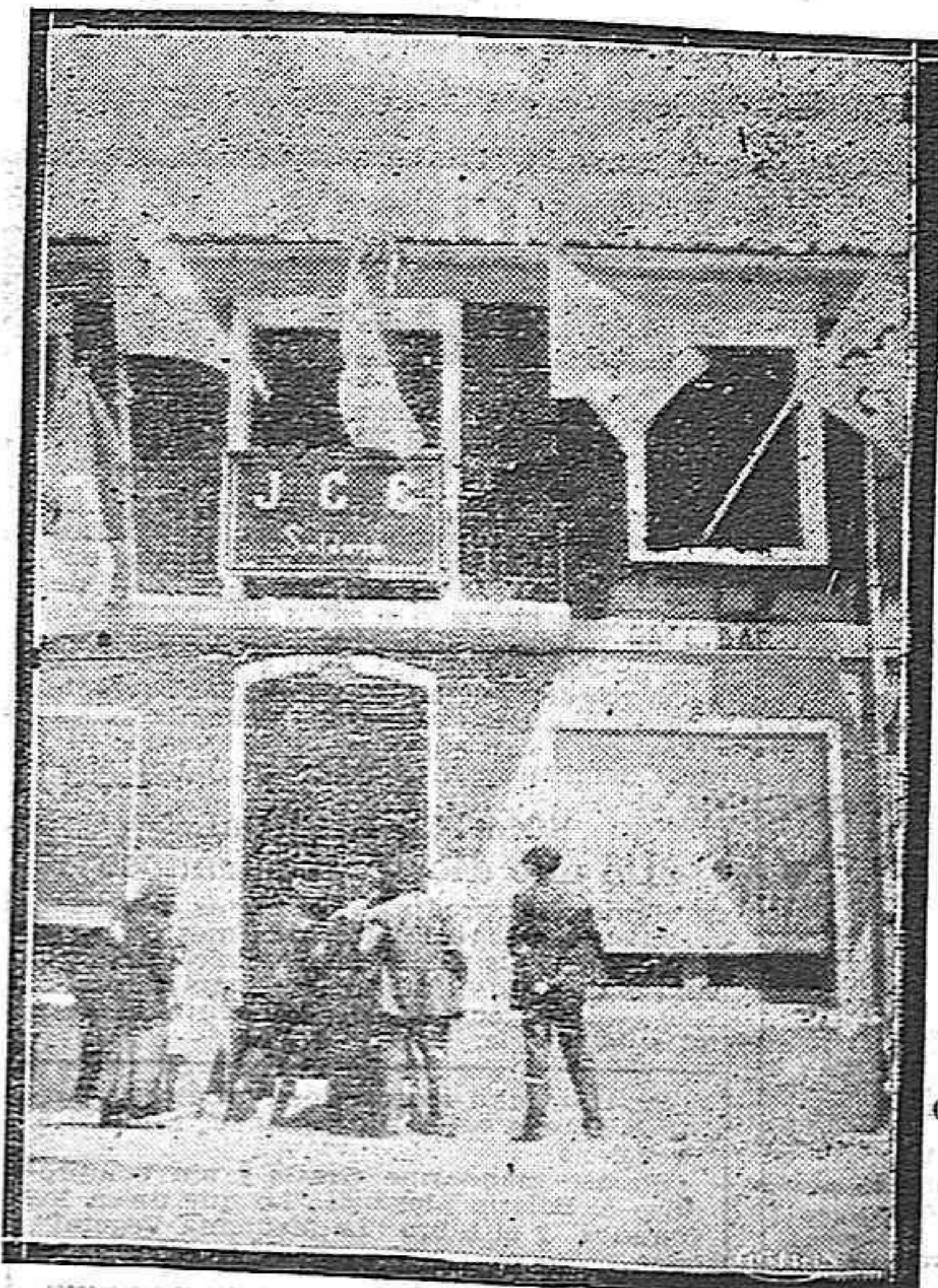
LAS JUVENTUDES CATOLICAS SALDAÑA.--El edificio social de la Juventud Católica Saldañesa, engalanado con las banderas de las secciones que asistieron a los actos del domingo