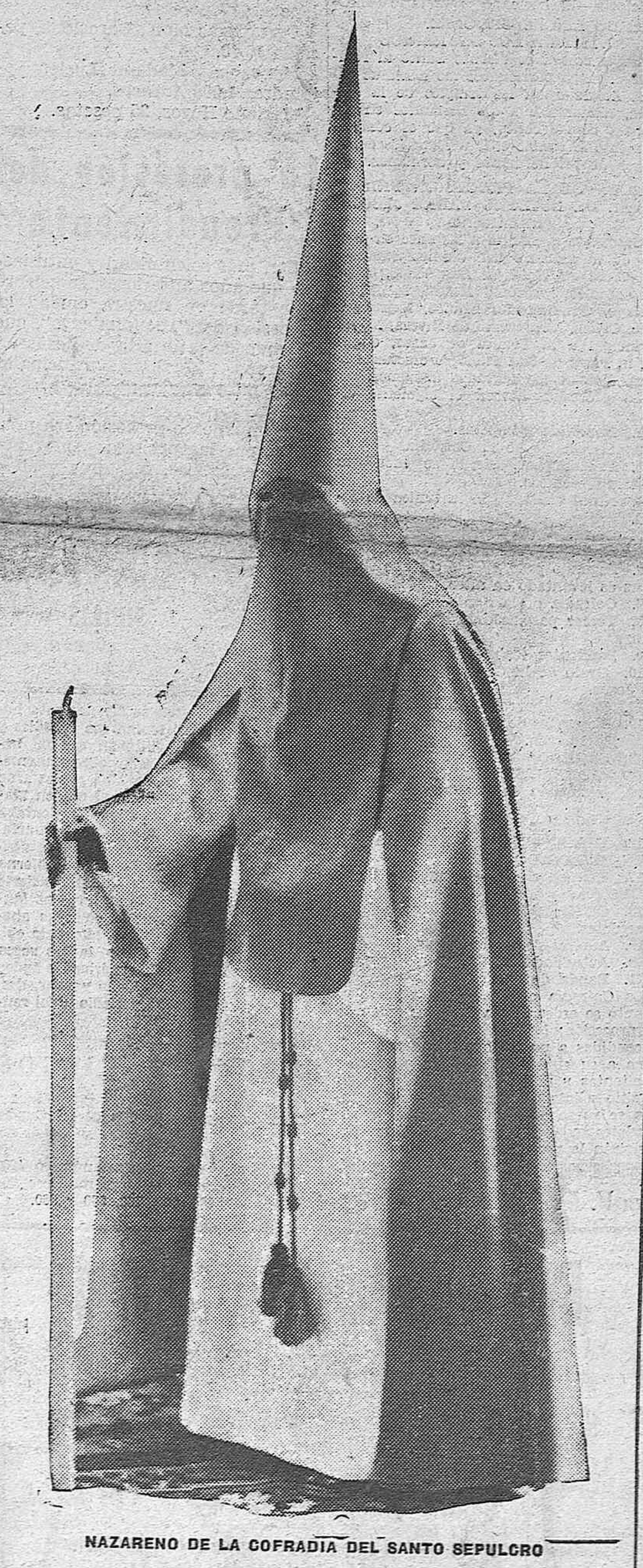
NAZARENO DE LA COFRADIA DEL SANTO SEPULCRO