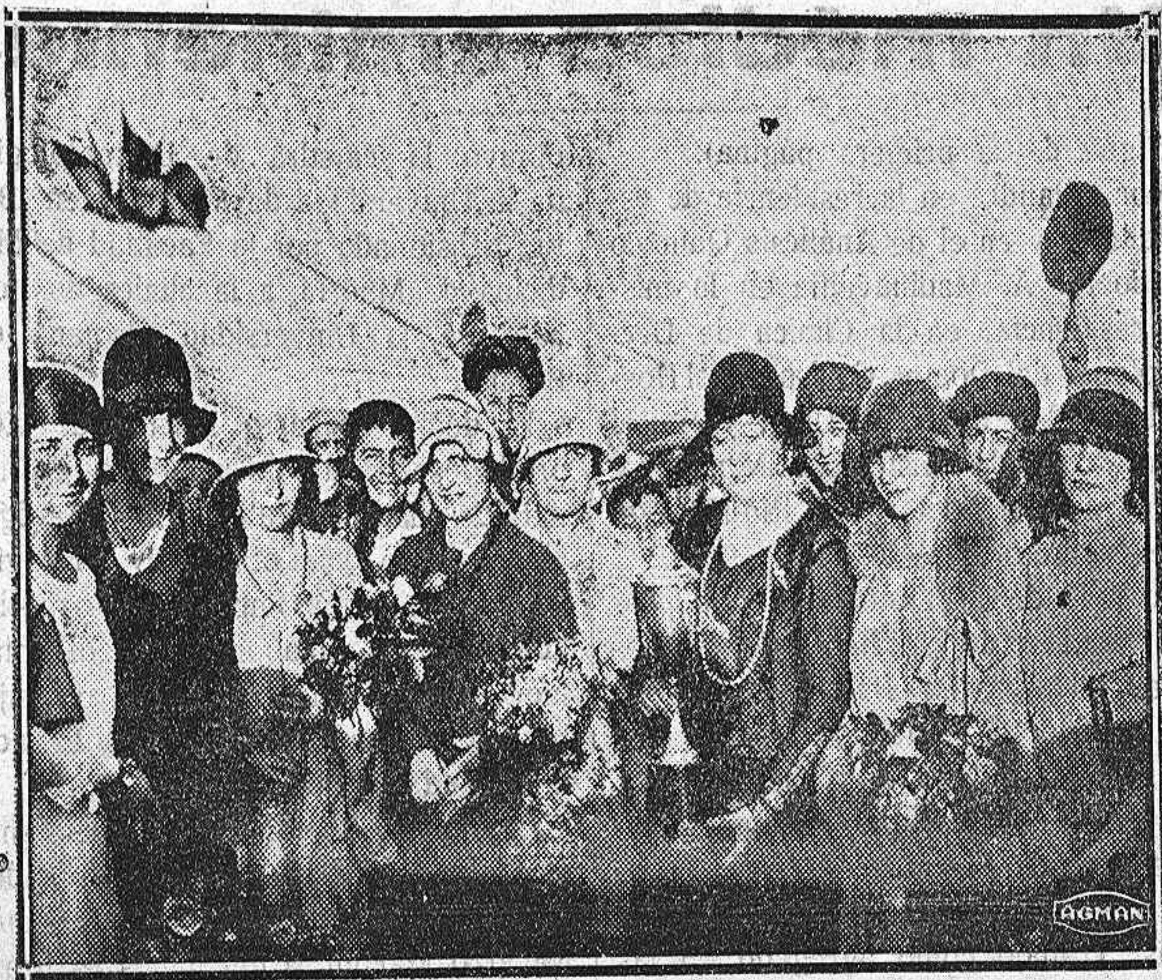
El partido de ayer.—En el palco de la presidencia.

Madrid.—La Policía ha detenido a dos sujetos llamados Agustín Sáinz y Marcelo José, que venían dedicándose a robar biciletas, que luego vendían a seis duros.