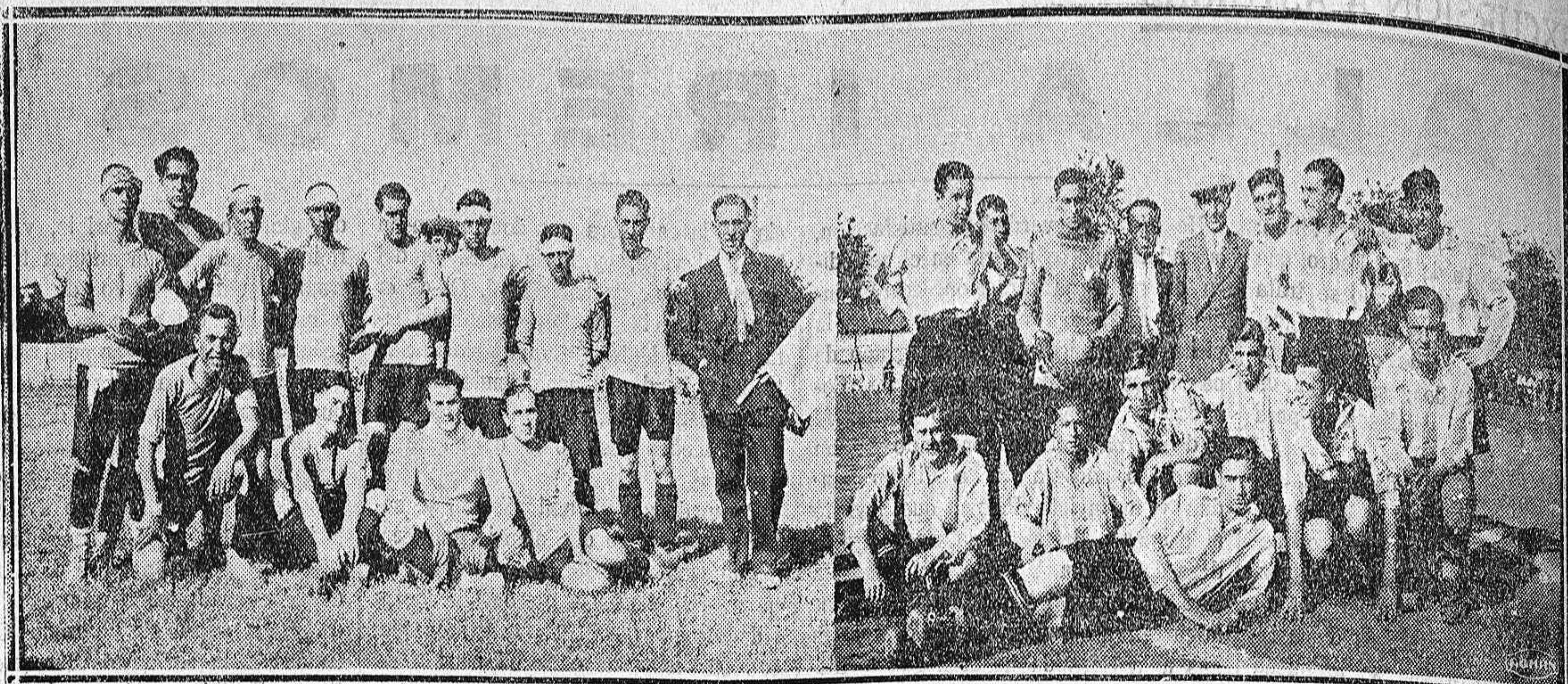
Del partido de ayer.—El Club Deportivo de Palencia