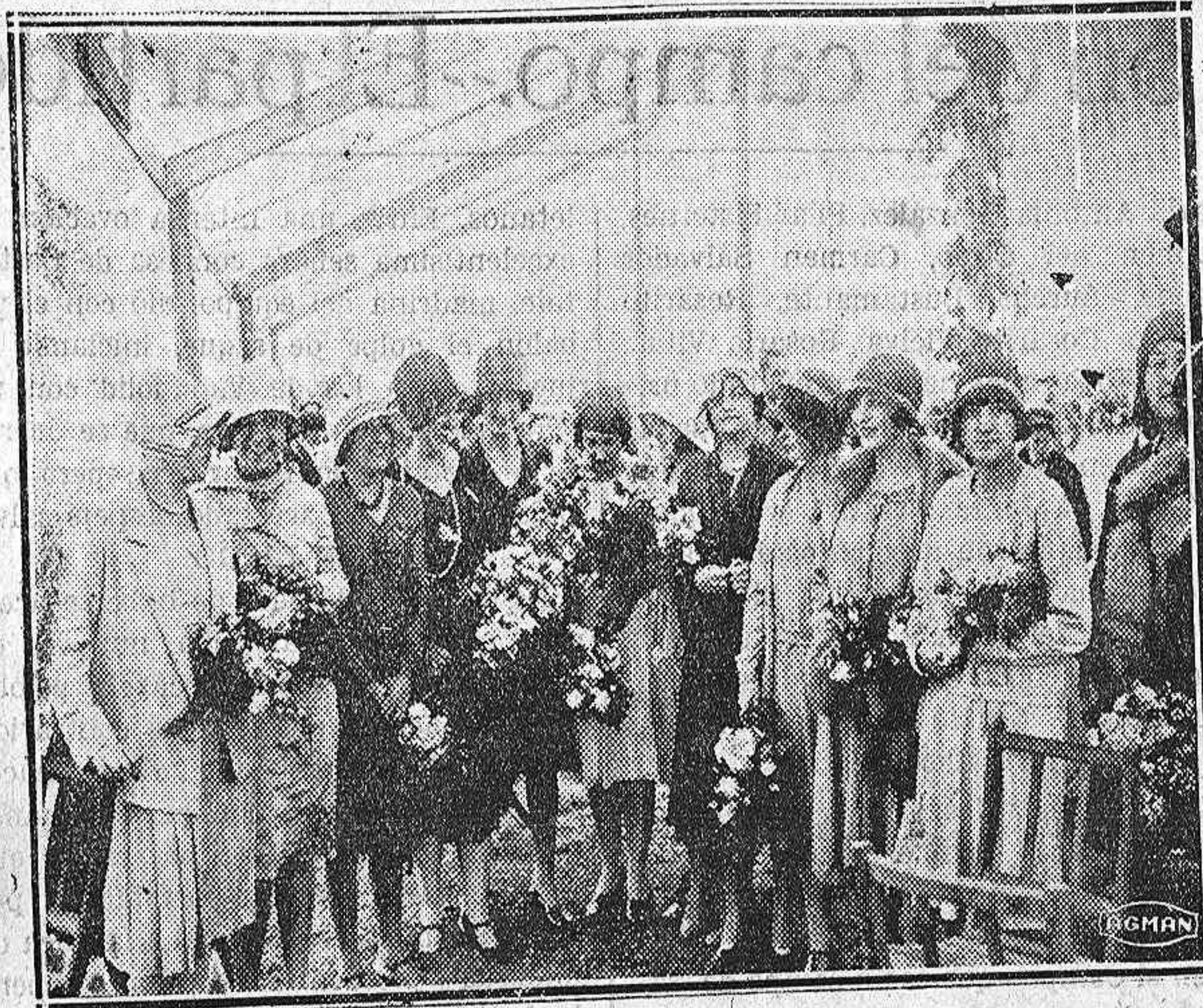
El partido de ayer.—Las madrinas.

Es un propósito muy interesante que amplificará el ya notable movimiento de viajeros que la propaganda turística palentina ha logrado desde la constitución de la Junta provincial.