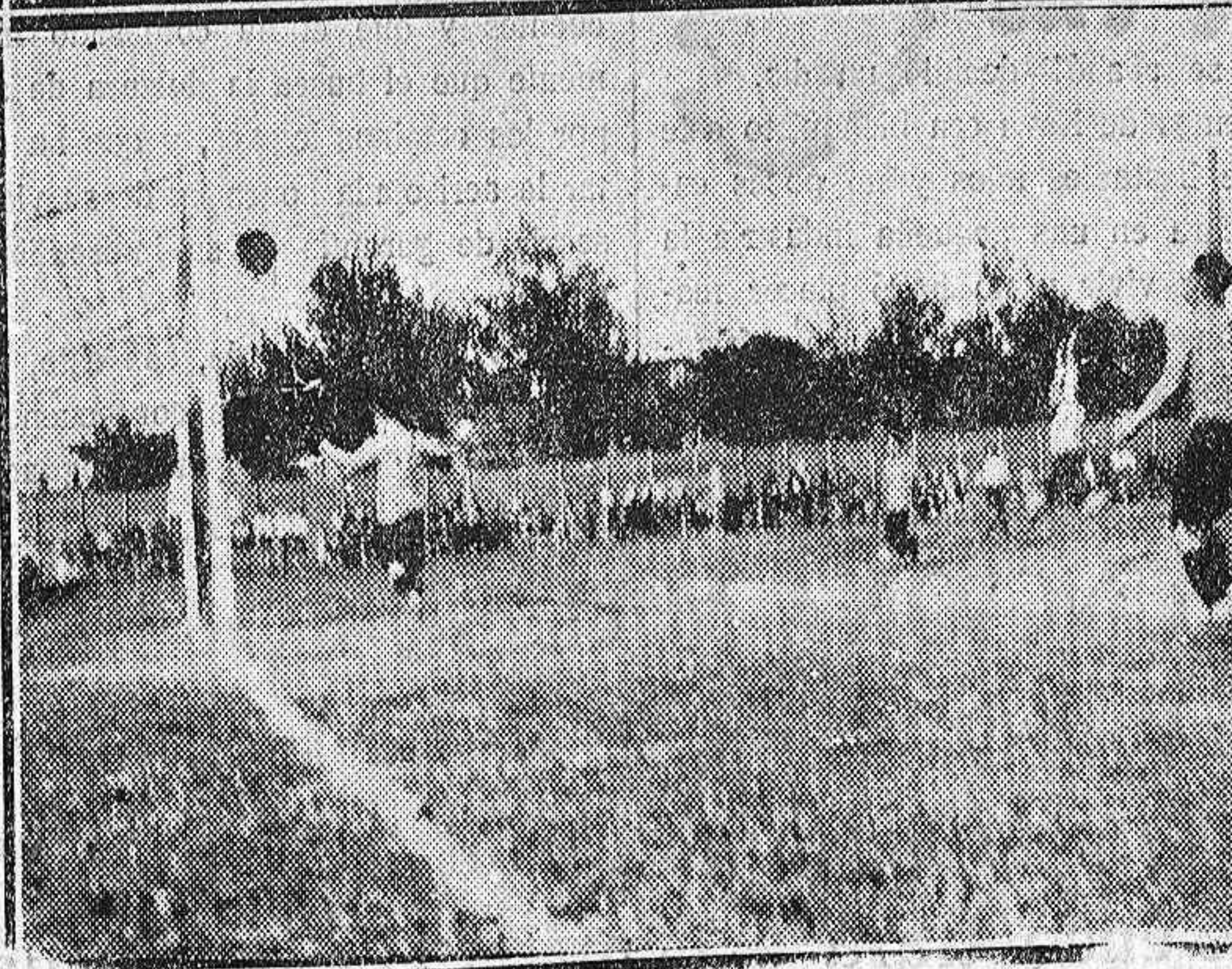
En el partido de ayer.—Las madrinas dirigiéndose a la tribuna de la presidencia