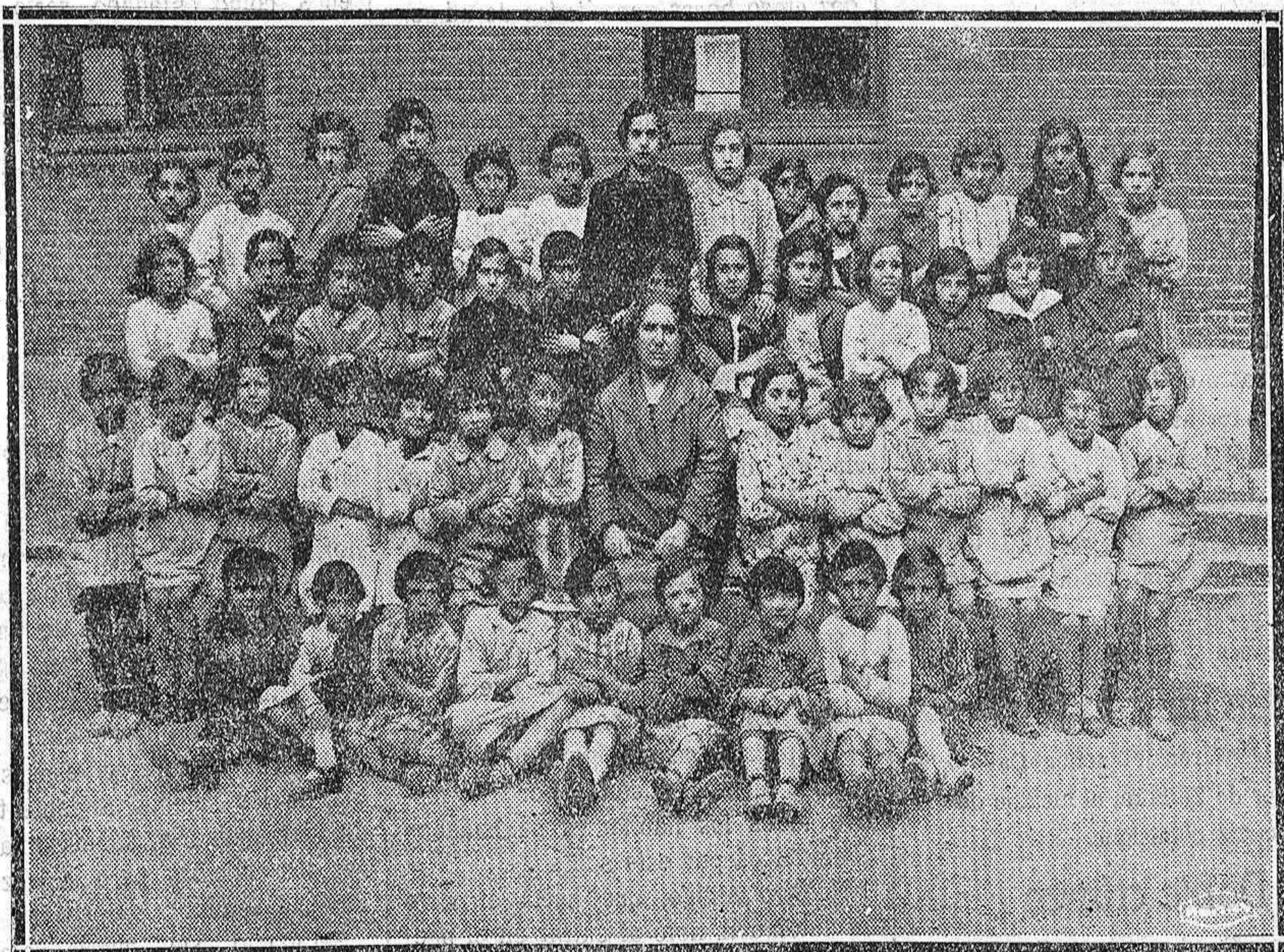
Grupo de niñas del segundo grado, de las Escuelas de la Graduada.

El presidente de la República recibió a la oficialidad y guardias marinas de «Elcano».