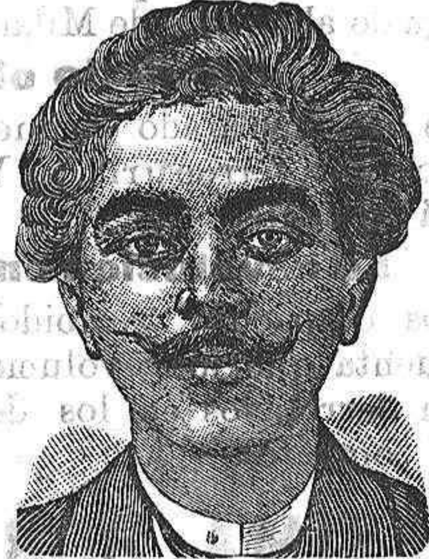
Después de 1º día de tratamiento