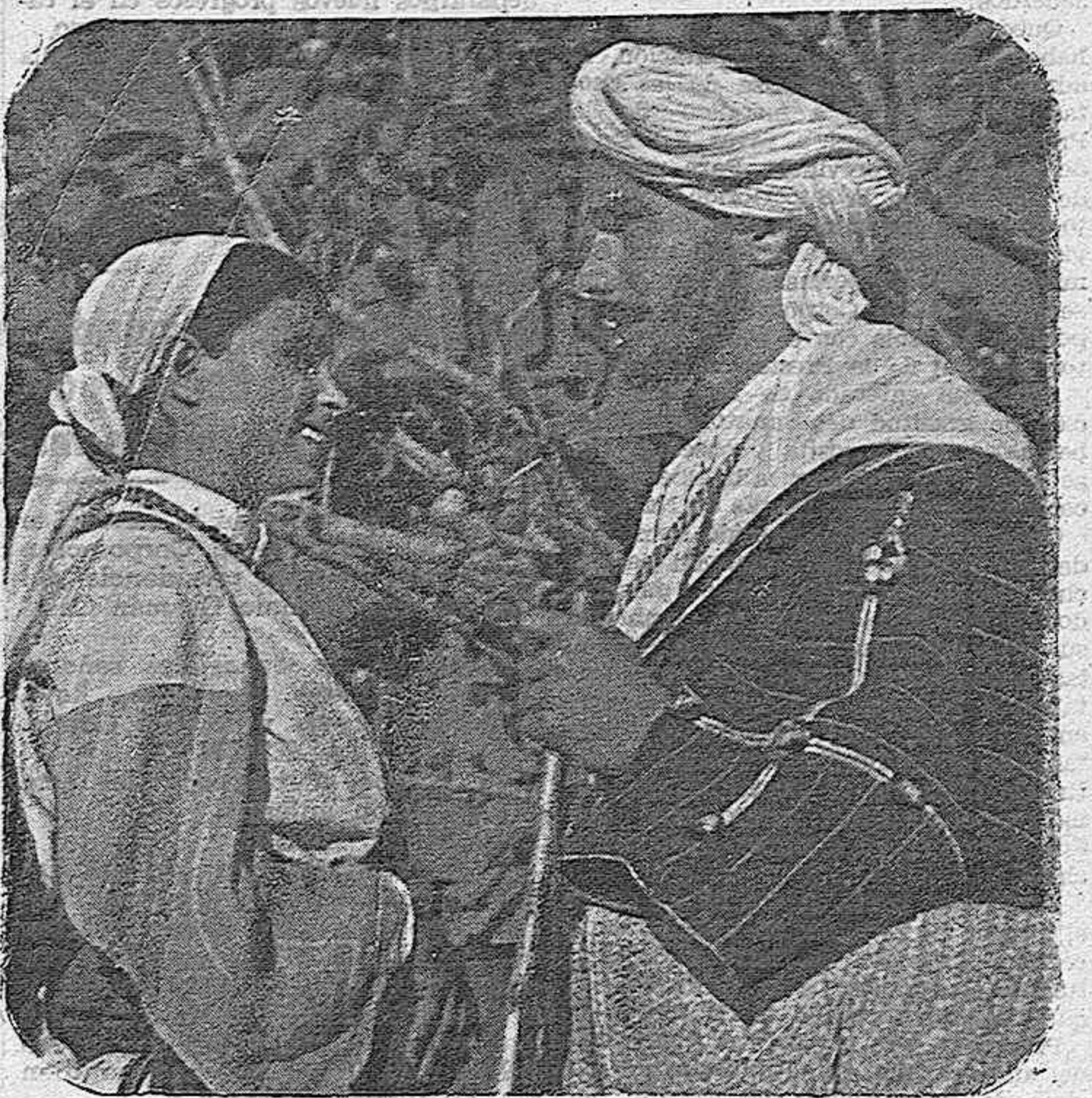
«ROMANCERO MARROQUI», UNA PRODUCCION ESPAÑOLA