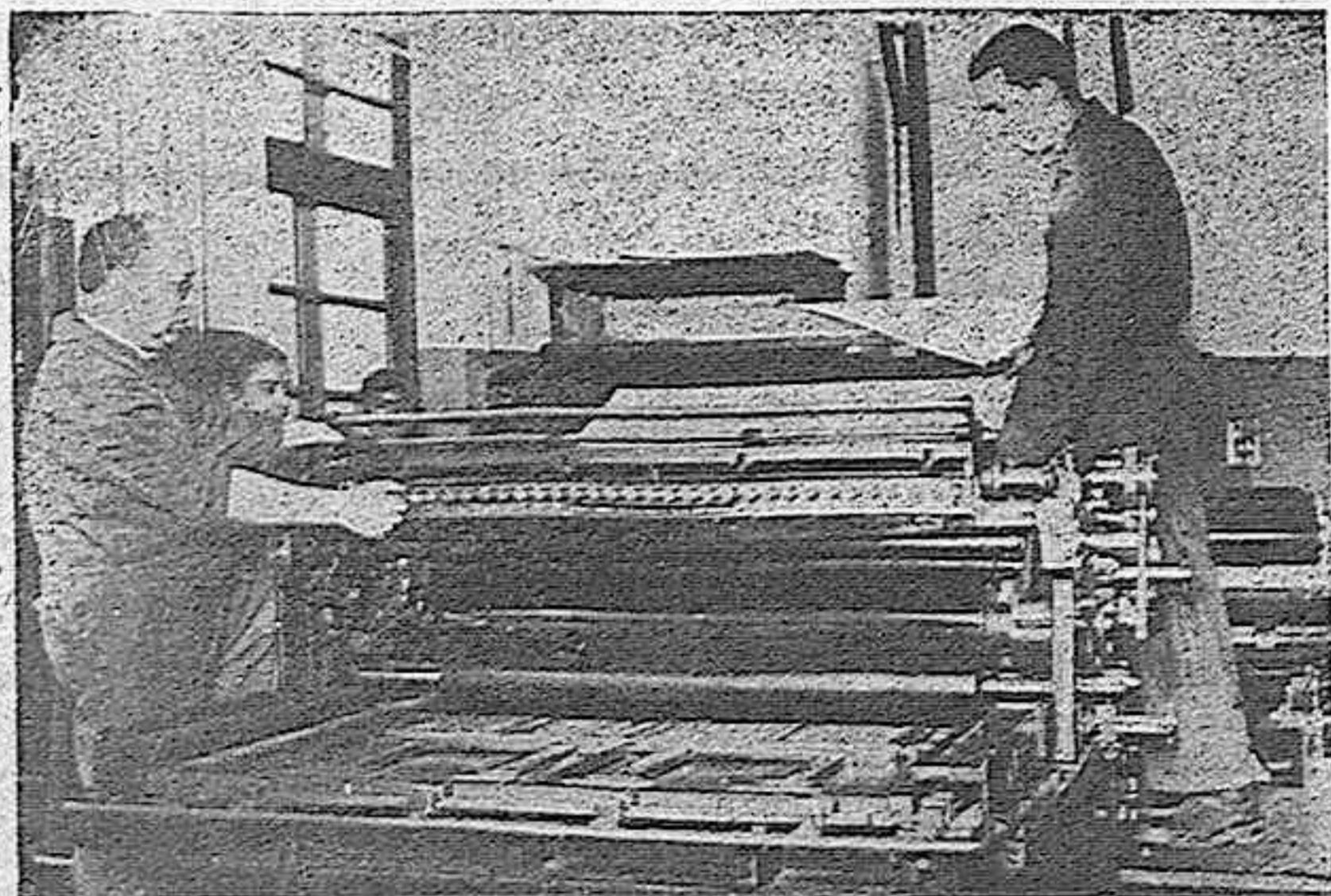
LAS PLANAS HAN ENTRADO YA EN MAQUINA, Y ES ENTONCES CUANDO EL JEFE DE LAS MISMAS HA DE PREPARAR «LA CAMA» PARA QUE LA IMPRESION SEA PERFECTA

Ya la ha escrito. Ya la ha transcrita y de todo. Y en su constante andar, inquirir, explorar, preguntar