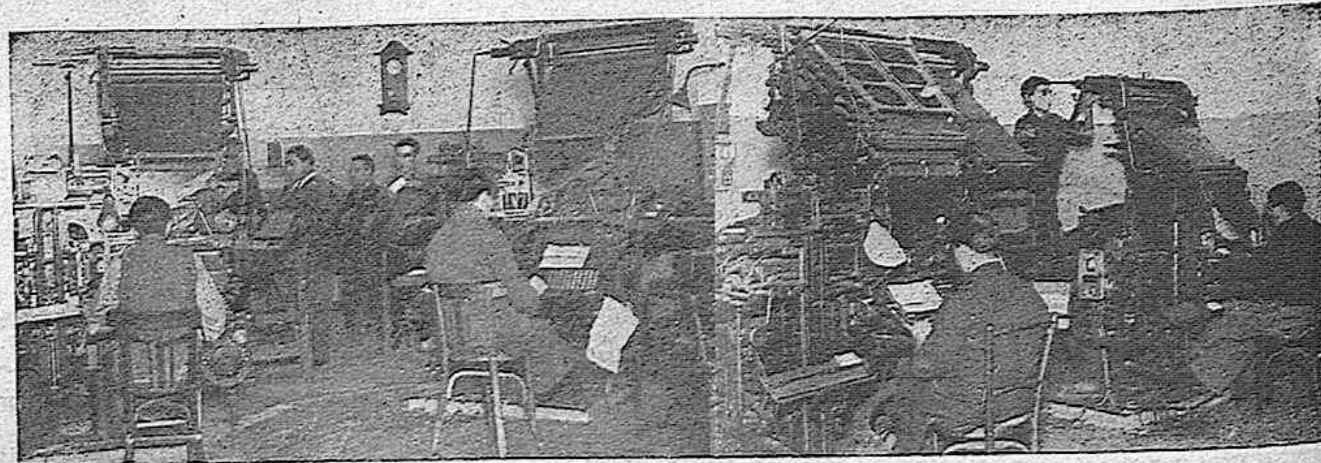
HE AQUI NUESTRAS CUATRO LINOTIPIAS, QUE HAN DE TRANSFORMAR EN LINEAS DE PLOMO LAS NOTICIAS QUE LLEGAN A LA REDACCION. ESTAS MAQUINAS, MAS QUE TALES, POR SUS PERFECCIONES, PARECEN POSEER UN CEREBRO HUMANO.