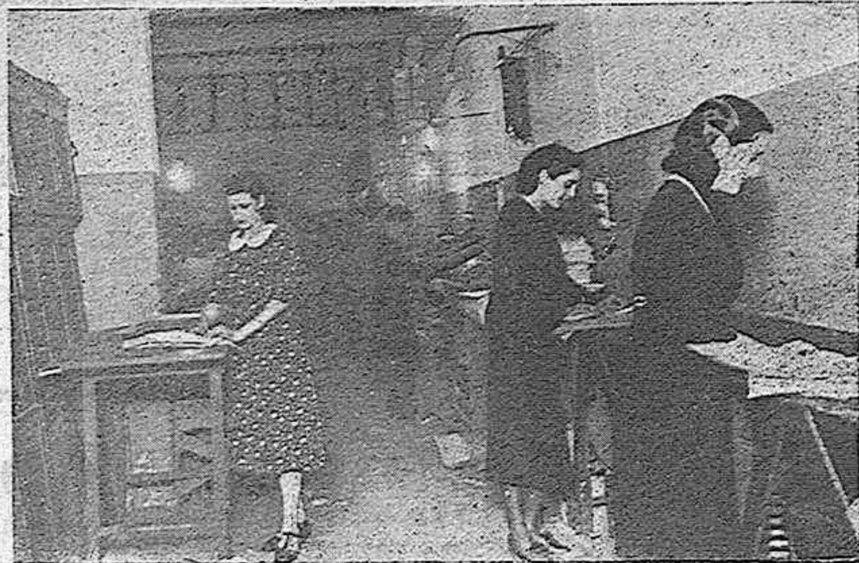
MIENTRAS TU, LECTOR, DUERMES, ESTAS SIMPATICAS MUCHACHAS QUE AQUI VES DOBLAN LOS PERIODICOS CON UNA AGILIDAD ASOMBROSA

redactor de calle recorre todos los puntos donde puede encontrarla. Explora, inquiere, pregunta, habla con todos y de todo. Y en su constante andar, inquirir, explorar, preguntar