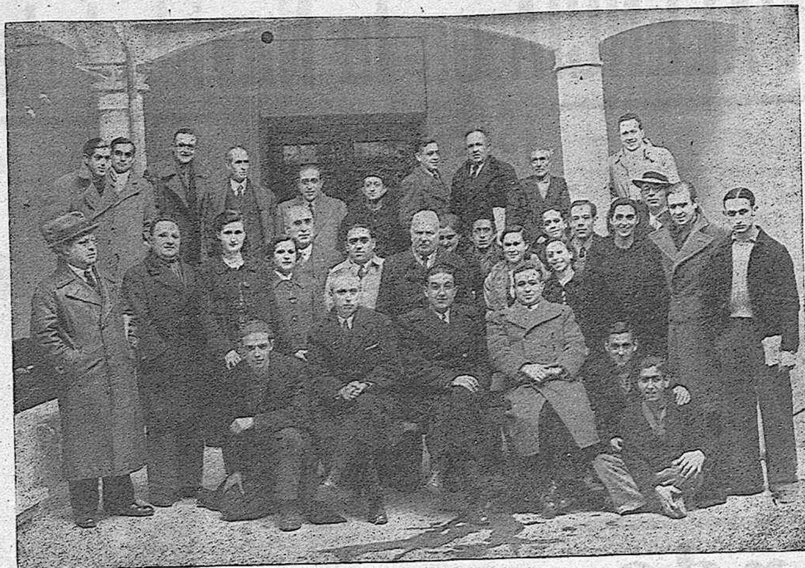
PARTE DEL PERSONAL DE REDACCION, ADMINISTRACION Y TALLERES DE «EL DIA DE PALENCIA», POSAN ANTE EL OBJETIVO DE NUESTRO SIN PAR FOTOGRAFO ESPIGA, QUE HA TENIDO TAMBIEN LA HABILIDAD DE APARECER ENTRE EL GRUPO

Y si te paras a leer las noticias que salen en un periódico, verás que estos teletipos nos suministran diariamente, información para un periódico de doble número de páginas que las que hoy, debido a las restricciones de papel, tiene nues-