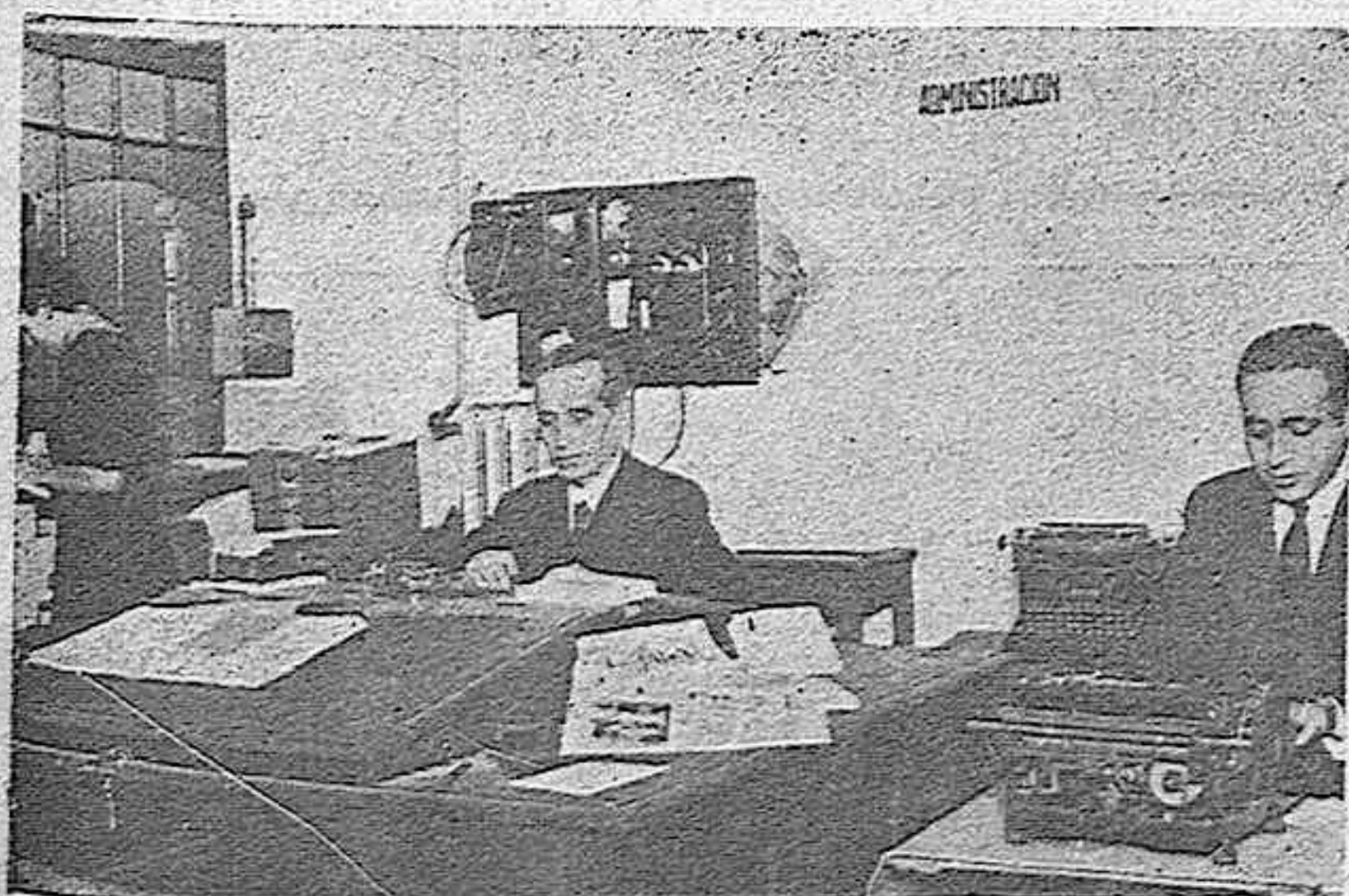
UNA DE LAS LABORES QUE MAS CUIDADO REQUIEREN EN UN PERIODICO ES SU MARCHA ADMINISTRATIVA. - APARECE EN LA FOTOGRAFIA EL SR. ADMINISTRADOR DE «EL DIA DE PALENCIA», ACOMPAÑADO DEL PERSONAL DE LA MISMA