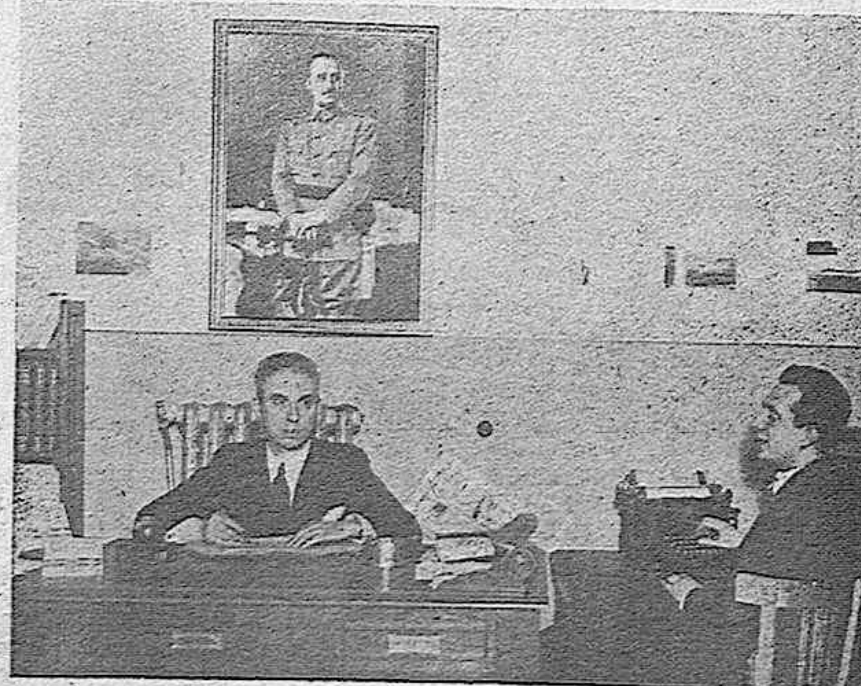
EL REDACTOR-JEFE DE «EL DIA DE PALENCIA», EN SU DESPACHO, DICTA UN TRABAJO COMENTANDO LA ACTUALIDAD DEL DIA.