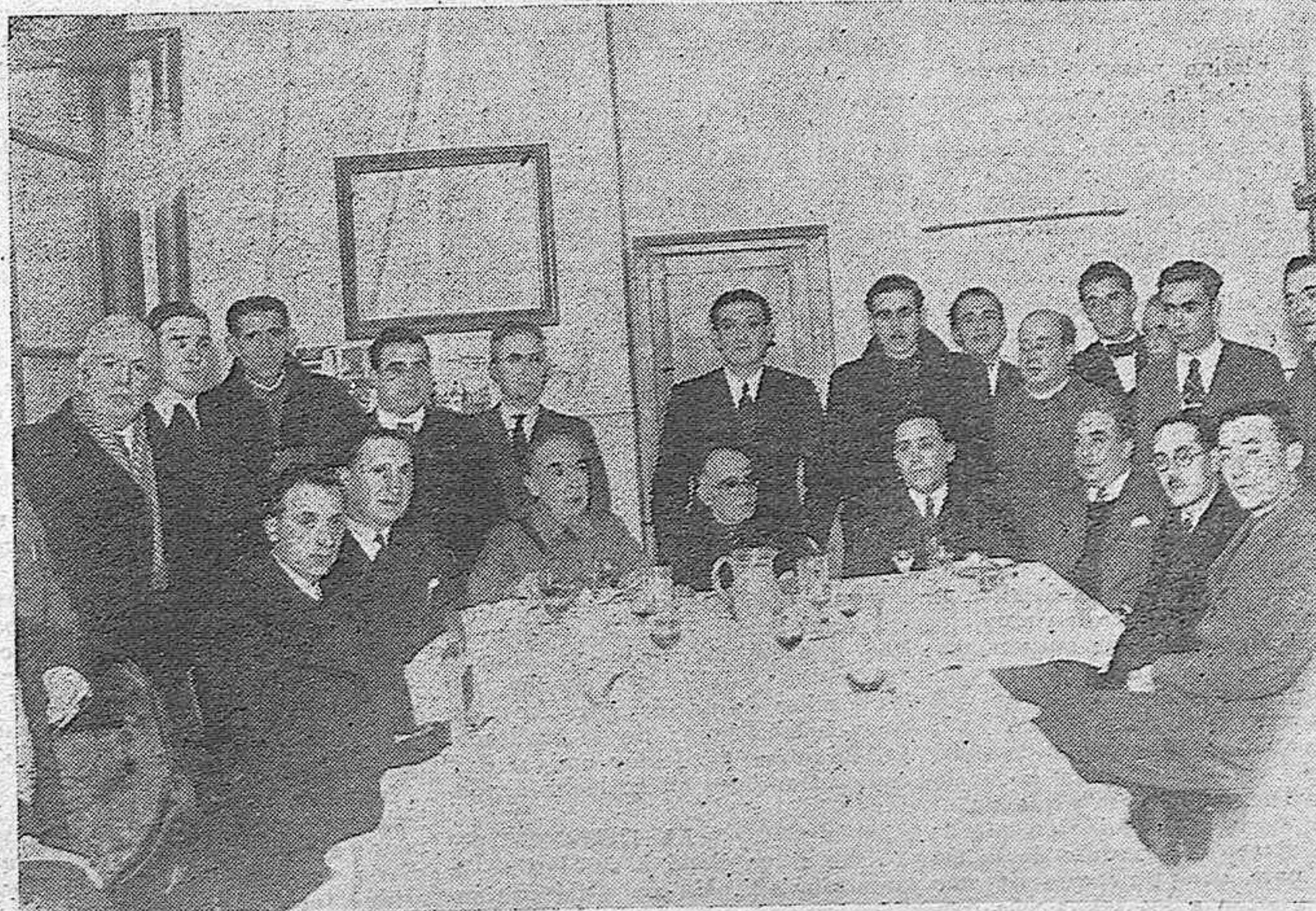
LAS DIGNISIMAS AUTORIDADES QUE ASISTIERON A LA BENDICION DE NUESTRO TELETYPOS. MOMENTOS DESPUES DE LA CEREMONIA, EN EL «LUNCH» QUE FUE OFRECIDO EN SU HONOR

A pesar de no ser hora habitual de transmisión en nuestros Teletipos, se hicieron por nuestra Redacción unas