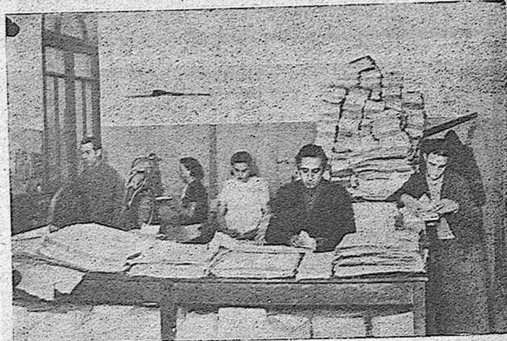
ANTES DE LLEVAR EL PERIODICO PARA SU DISTRIBUCION, HAY QUE PREPARAR LAS FAJAS Y REALIZAR LAS MULTIPLES OPERACIONES QUE EXIGEN EL RAPIDO Y JUSTO DESTINO DE CADA PERIODICO.—UN RINCON DE LA ENCUADERNACION DE NUESTRA IMPRENTA, DONDE SE EFECTUAN ESTAS OPERACIONES

jefe, que han de ser quienes, inmediatamente, ordenan al regente de la imprenta, que se "componga" Y es entonces, cuando la cuartilla aquella pasa a las linotipias. A ese modelo de máquinas que, más que tales, parecen personas, con su ce-