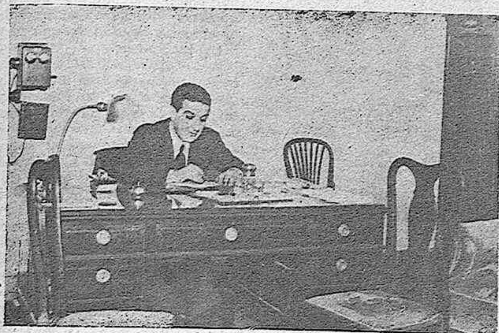
NUESTRO DIRECTOR, EN SU DESPACHO DE TRABAJO, PLANEA LAS NORMAS PARA EL PERIODICO DEL DIA