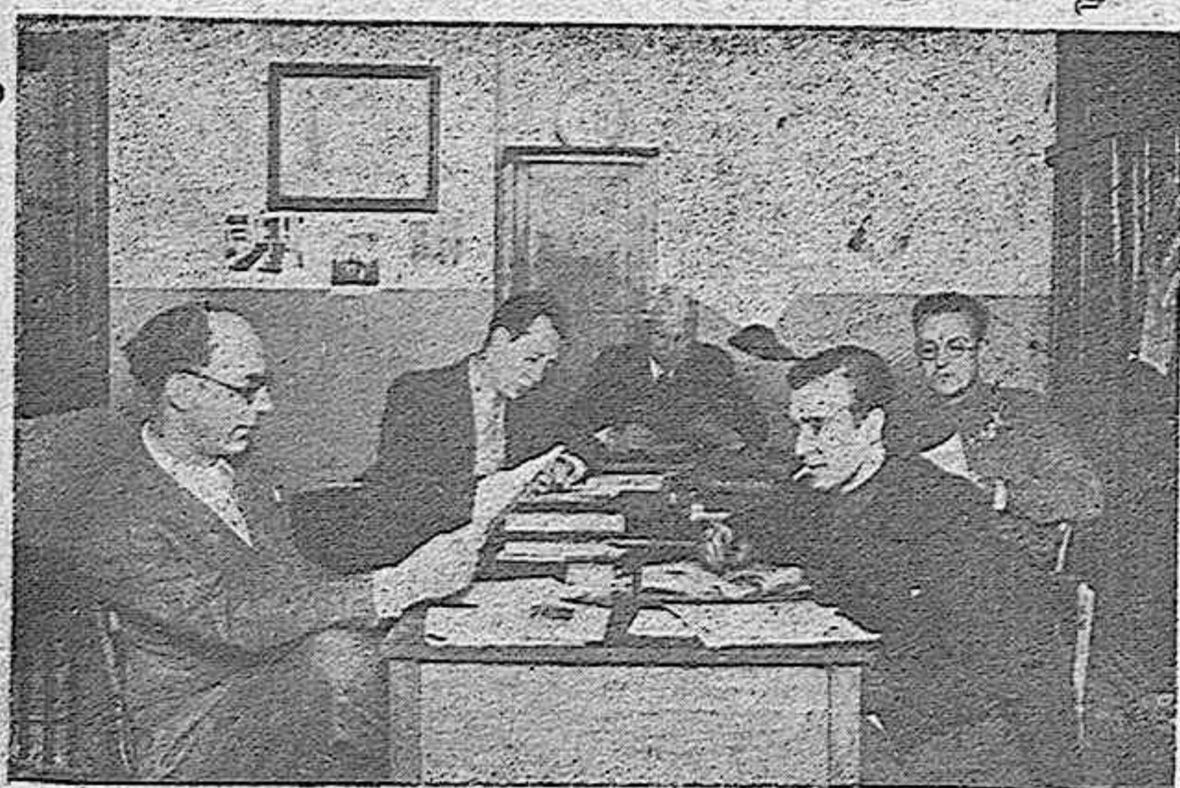
LOS REDACTORES DE NUESTRO PERIODICO, EN SUS MESAS DE TRABAJO, LLENAN SUS CUARTILLAS DE LAS INFORMACIONES QUE CADA UNO DE ELLOS TIENE A SU CARGO.

15.000.000 de ptas. - (Madrid.-Reserva.) (VEA LISTA COMPLETA DE PREMIOS EN ULTIMA PLANA.)