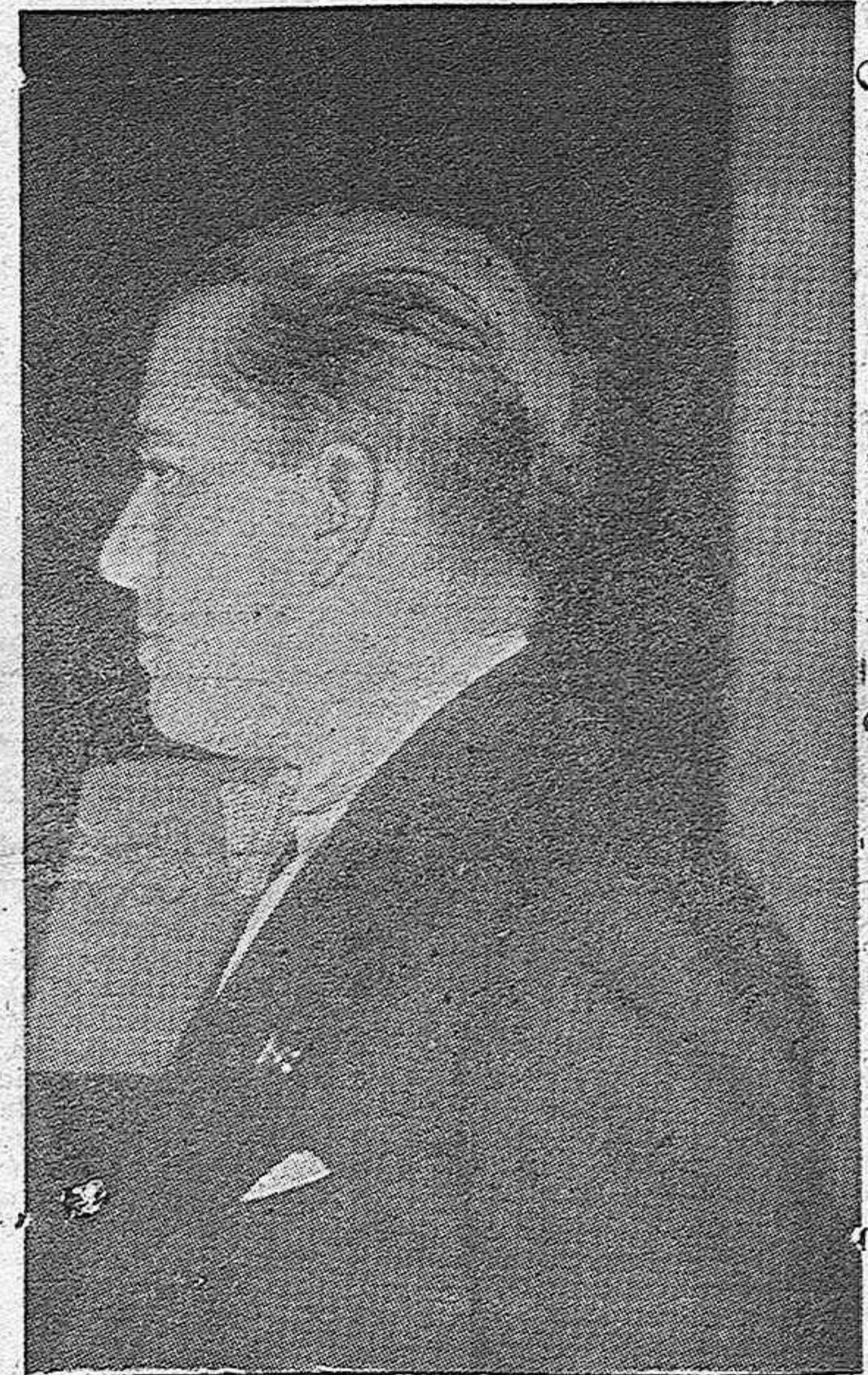
(El discurso del ministro de Negocios Extranjeros italiano, se publica en las páginas quinta y octava)

Proclama la política exterior de Italia ante los últimos acontecimientos de Europa