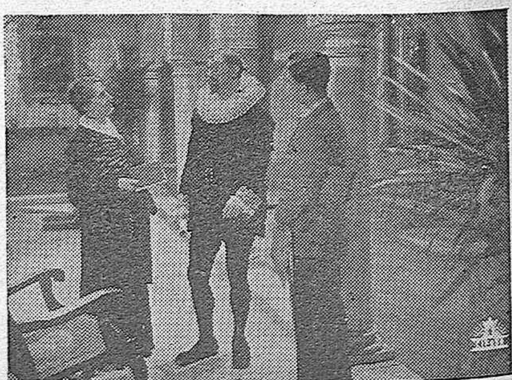
"EL GENIO ALEGRE". SUPERPRODUCCION "CIFESA" QUE RECOGE CON VERDADERO ACIERTO LA PRECIOSA COMEDIA DE LOS HERMANOS ALVAREZ QUINTERO