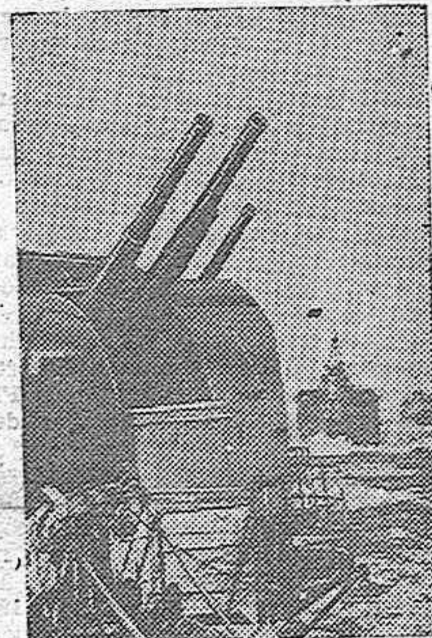
He aquí uno de los barcos de guerra ingleses que navegan por el Mar del Norte en servicio de protección de los convoyes mercantes