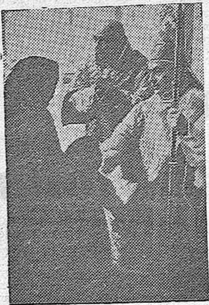
La presente «foto» recoge un momento del solemne besamanos, durante la ceremonia religiosa con que se conmemoró la fecha de las bodas de plata del señor obispo de Madrid - Alcala