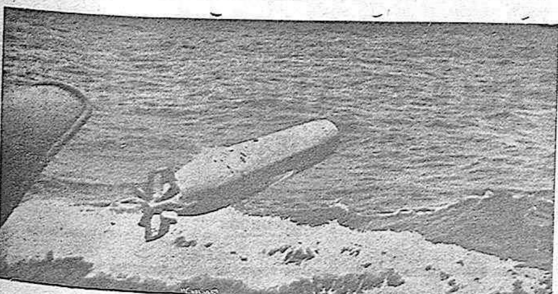
He aquí el arma terrible, el torpedo, que temen las «líneas de flotación» de los buques.

QUINADO C. B. B. TÓNICO--APERITIVO--RECONSTITUYENTE--DIGESTIVO