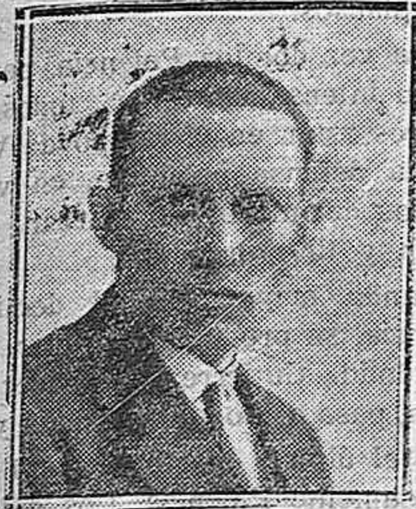
DON FERNANDO UNAMUNO

El café es para el español intelectual algo imprescindible, sin el que muchas producciones que nos han asombrado no hubieran llegado a nacer.