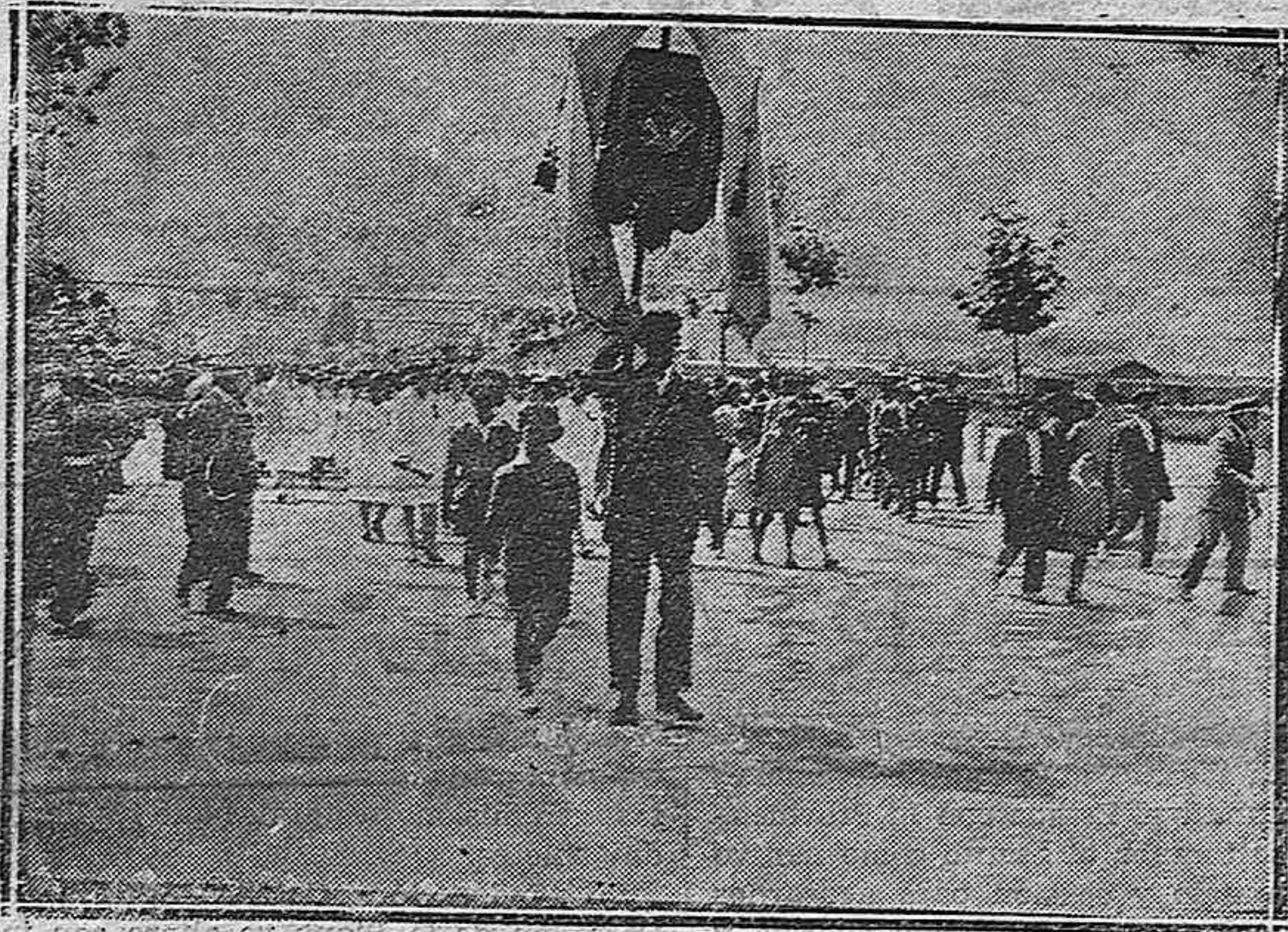
El Orfeón Burgalés acompaña a la Coral palentina hasta el Teatro Principal