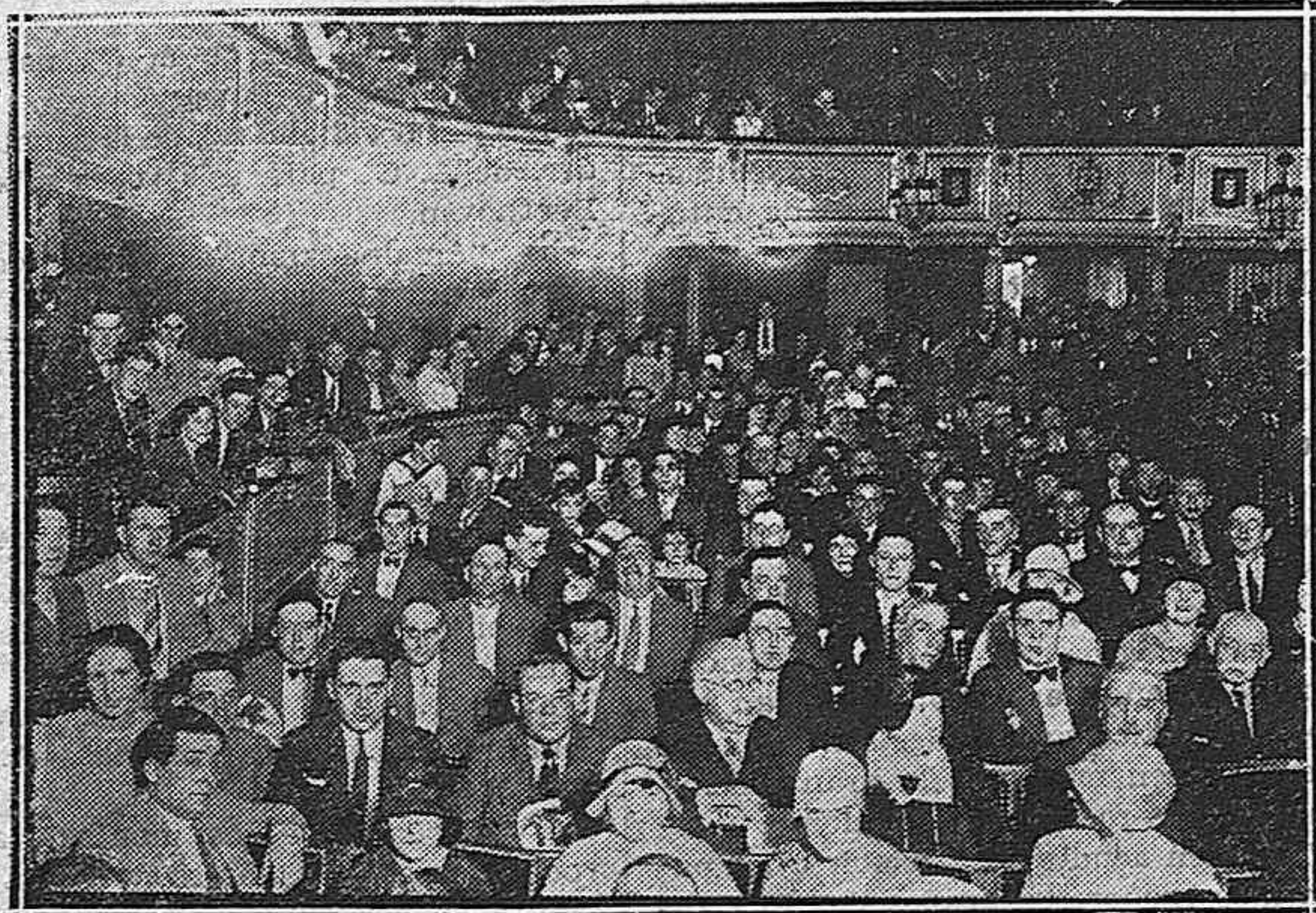
Otro aspecto del Teatro durante el concierto de la Coral

gan sus ecos en el bosque, dos niñas aún se prenden en la vuelta rauda de sus últimos giros y despacio, mientras el largo crepúsculo de Castilla nos habla de gravedades y hondas lejanías, la muchedumbre desfila alegre y bulliciosa para volver a encontrarse una hora después en el Espolón.