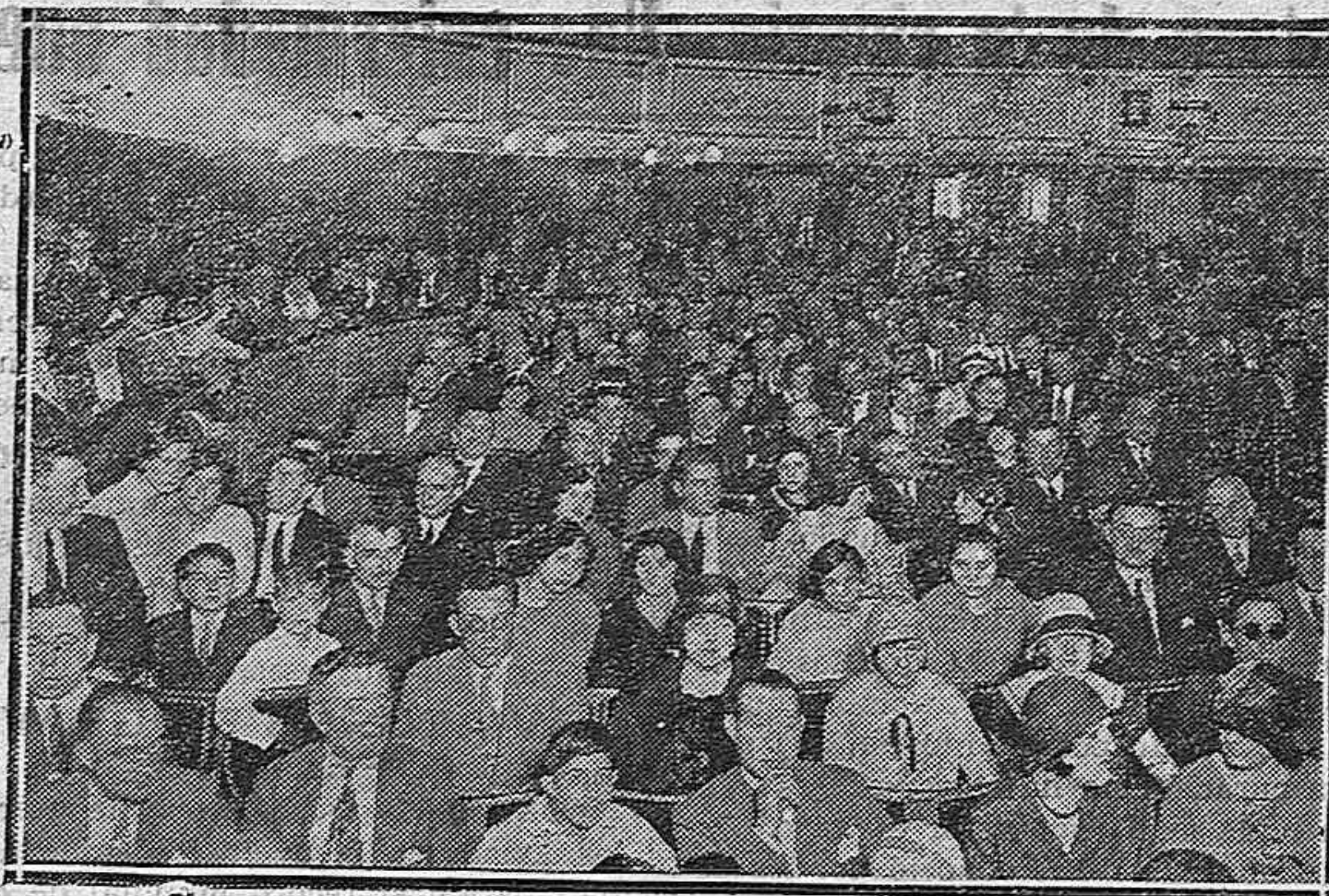
El Teatro Principal de Burgos ofrecía el aspecto de las grandes solemnidades

Fuera de programa, y para satisfacer los deseos del público, cantaron la mar-