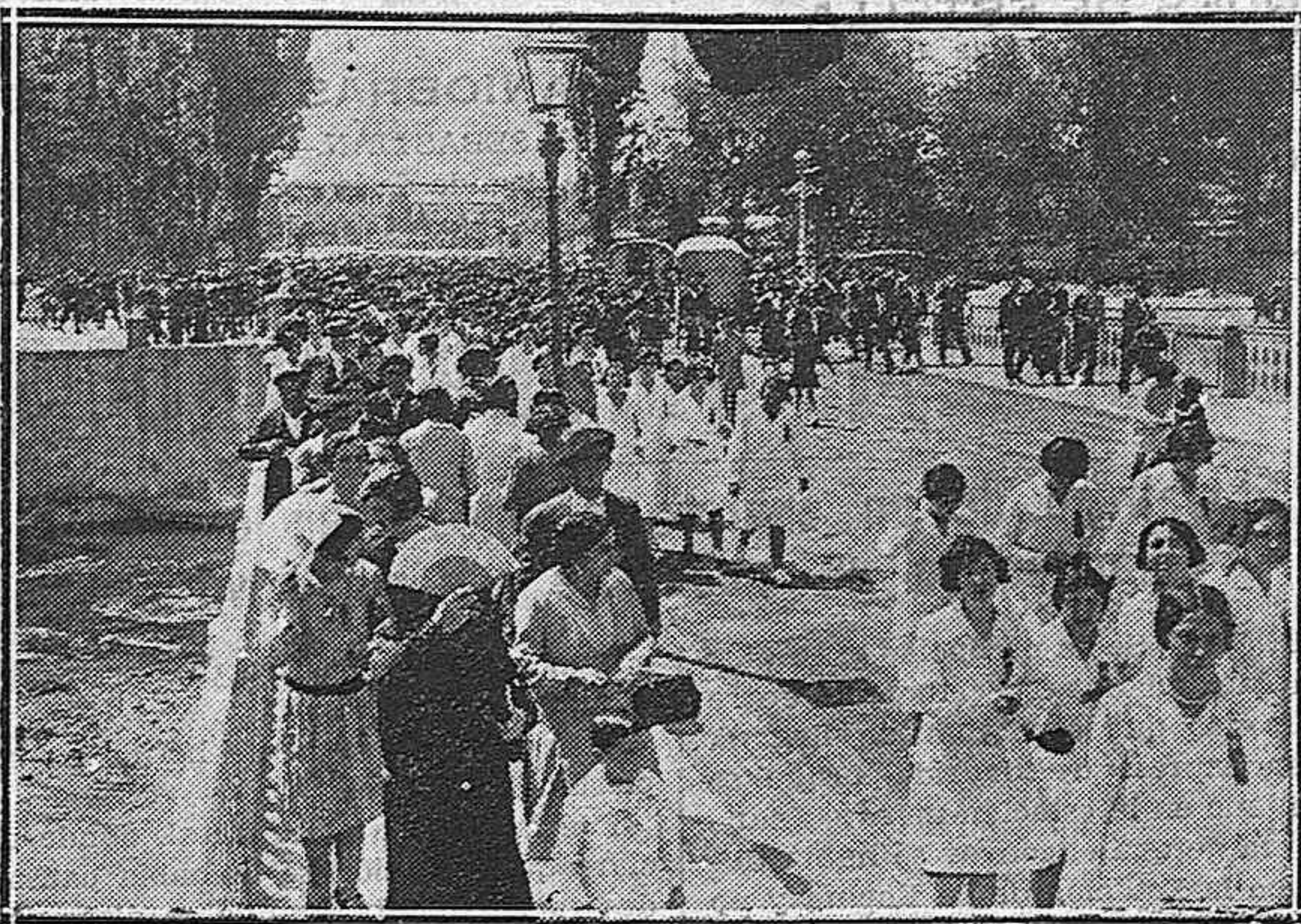
Un numeroso público burgalés comenta el entusiasta recibimiento dispensado a la Coral

NUEVO SERVICIO AEREO Se inauguró el servicio postal y de