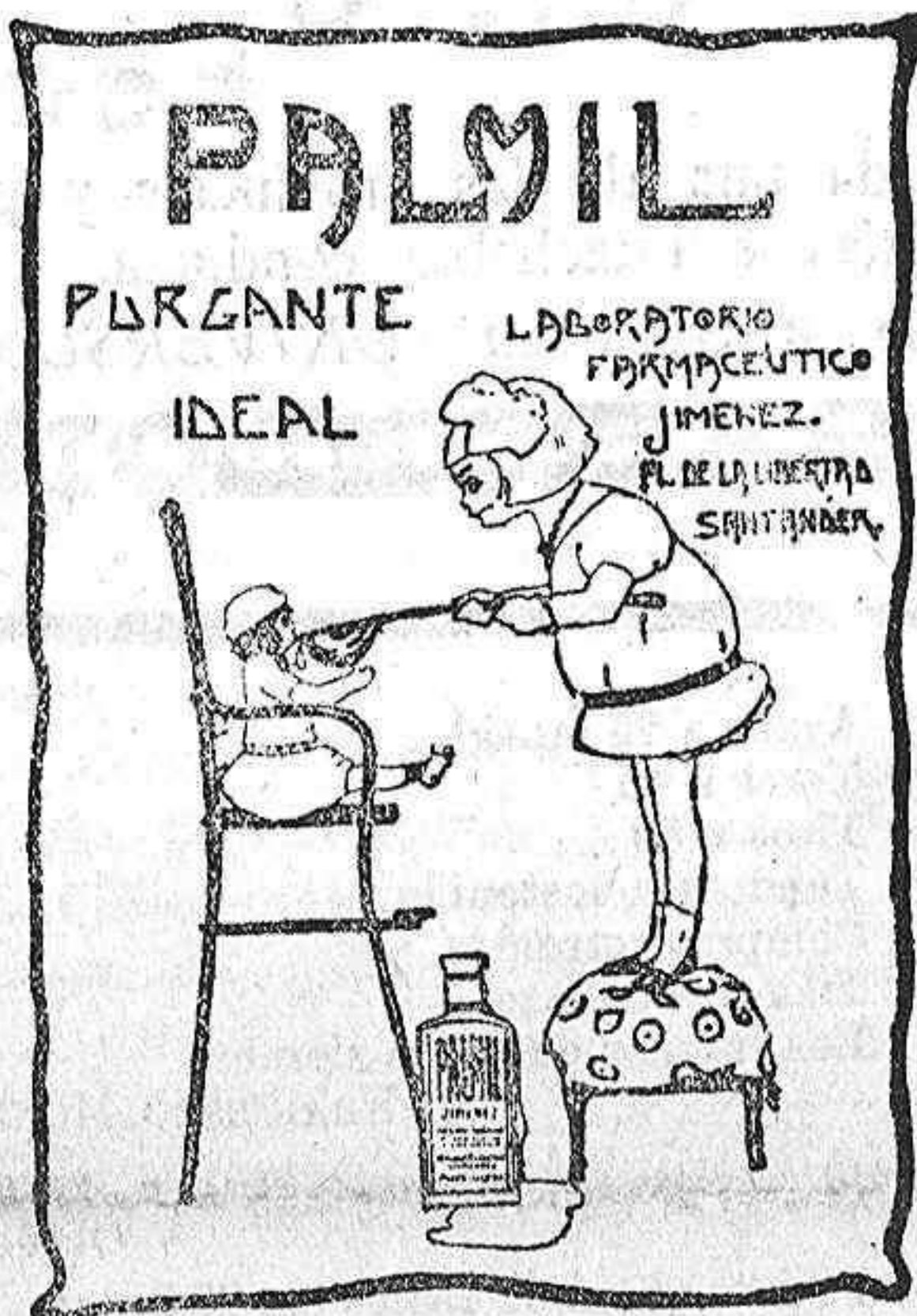
De venta en farmacias y droguerías.

Texto variado y de interés para toda clase de cultivadores, ofrecen dichos números, que los completan las artísticas portadas que acreditan el buen gusto de los confeccionadores de esta popular ilustración agrícola que honra a la prensa española y que es la que prefieren los agricultores y ganaderos más ilustrados. Un número de muestra lo facilita la Administración, calle Notariado, 2, principal, Barcelona, gratuitamente.