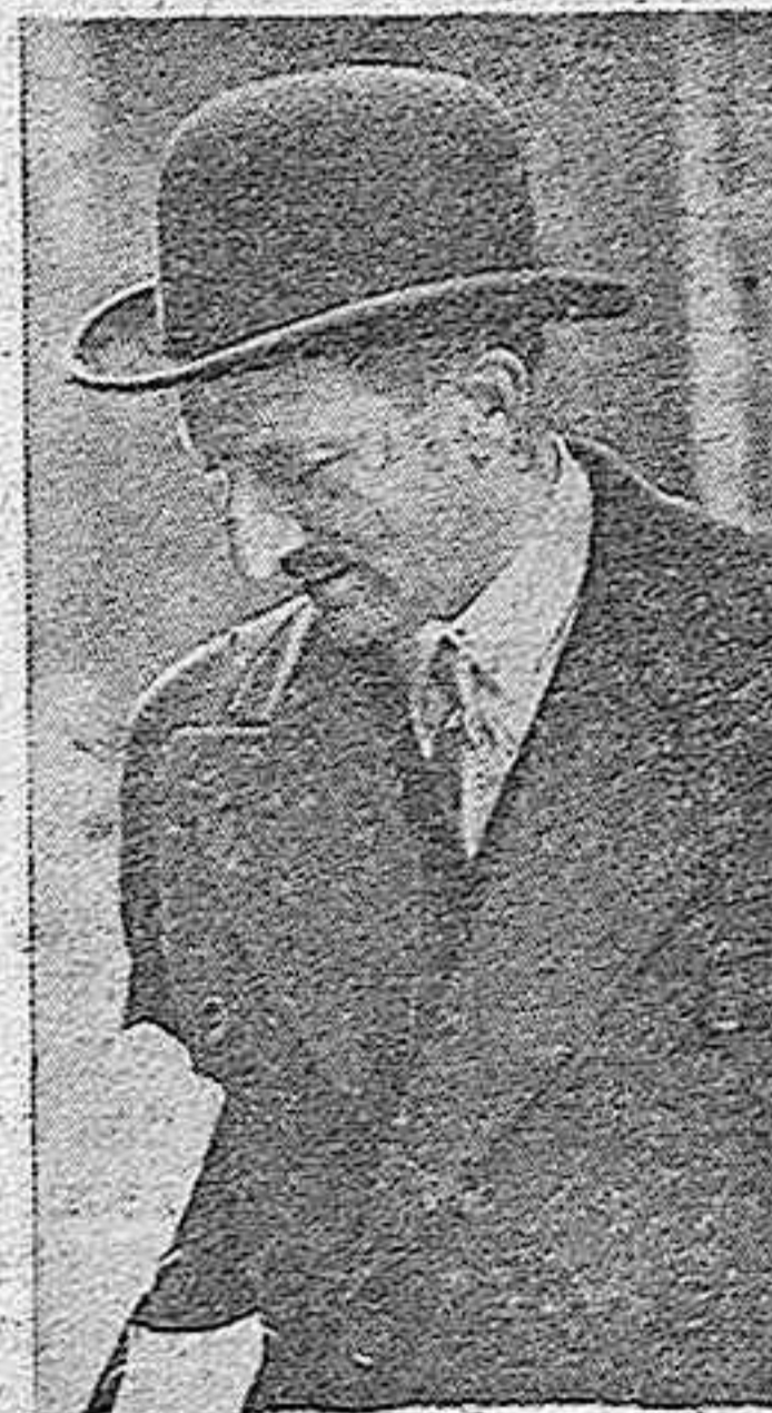
(Información en QUINTA plana.)