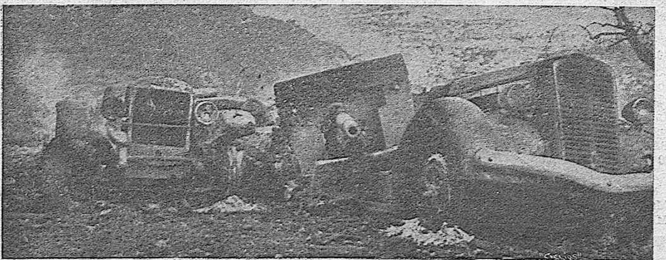
Al abandonar las tierras de Cataluña los rojos han dejado recorrido lleno de material. Aquí aparecen dos camionetas alcanzadas por nuestra heroica aviación cuando transportaban armamento hacia la frontera