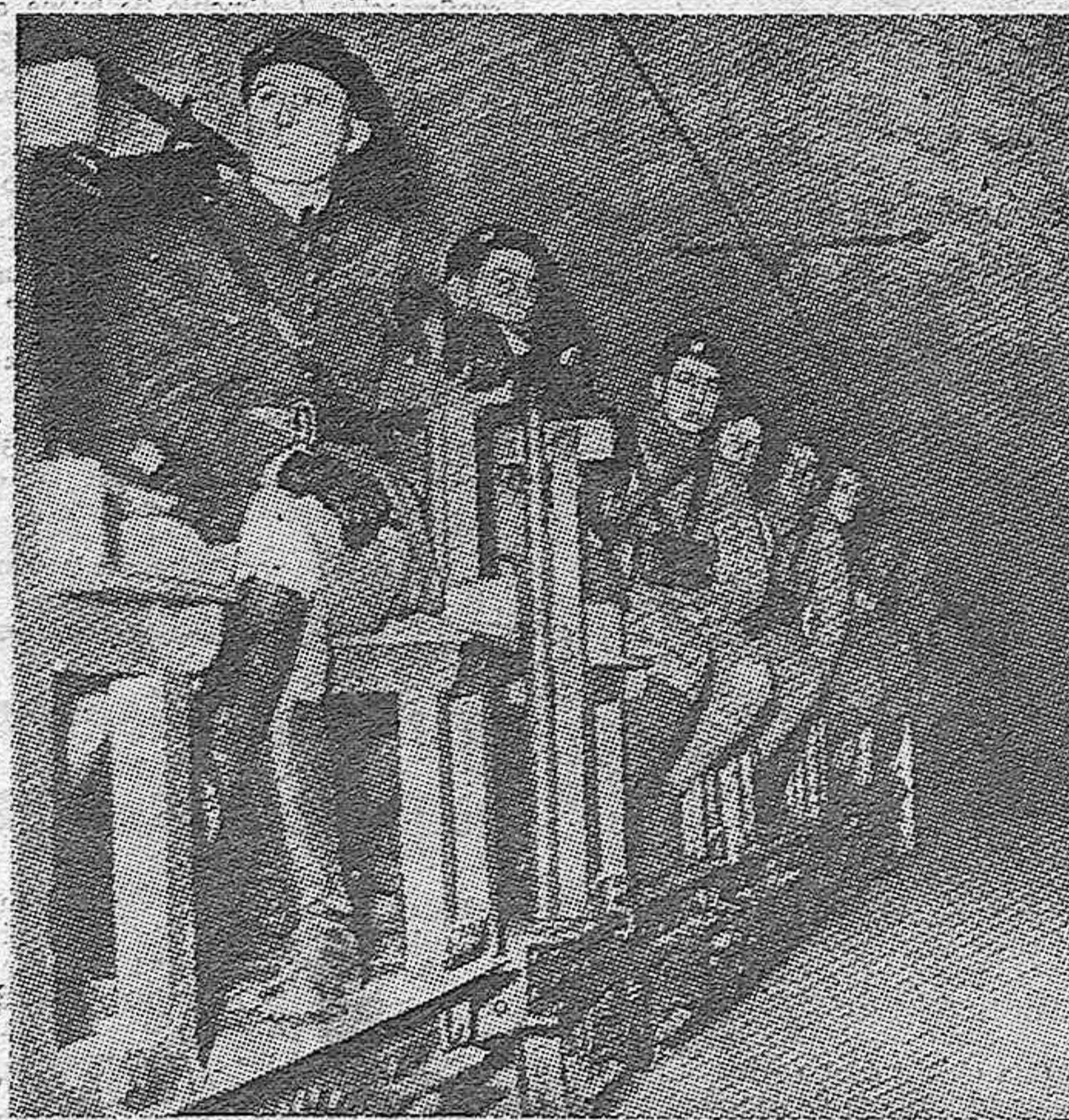
En los túneles de la línea Maginot.