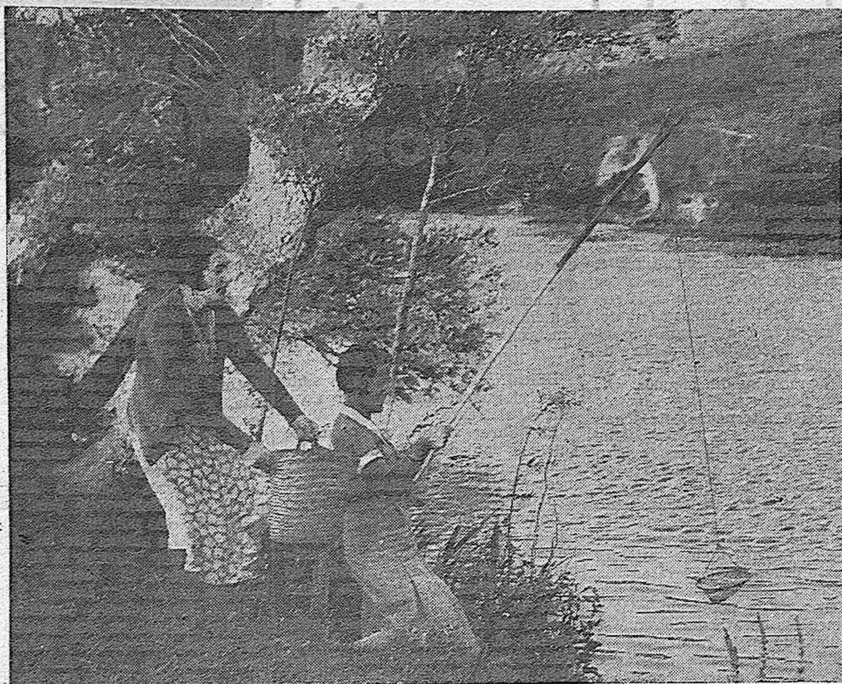
Una de las pescas más atrayentes, es, sin duda, la del cangrejo. Hay entre los palentinos verdaderos "virtuosos" del retel y... de las sabrosas merienda-cenas que, al socaire de ir "a pescar cangrejos", se organizan en nuestra provincia—tan abundante en estos riquísimos crustáceos—, cuando el sol no está sobre el horizonte y la frescura del terreno invita a una feliz contemplación de la naturaleza. Ved aquí uno de estos bellísimos cuadros, captado por el delicado gusto artístico de nuestro fotógrafo

Cirujano electrorradiólogo Consulta y operaciones en el SANATORIO QUIRURGICO DE JESUS NAZARENO Calvo Sotelo, 1. (Jardínillos) De 12 a 2. Teléfono 216