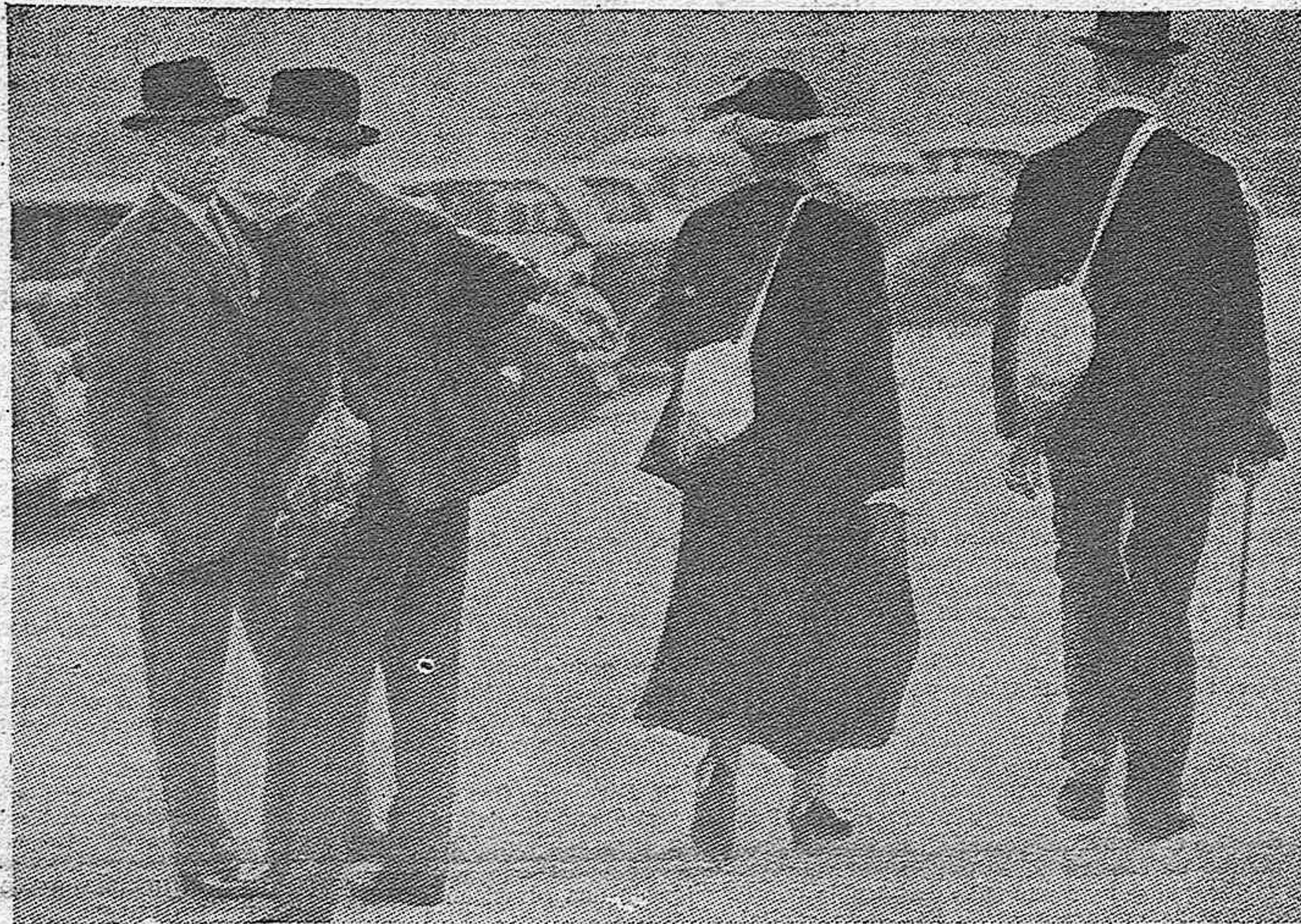
El jefe del Gobierno inglés y su señora, a pie por las calles de Londres, llevando en bandolera, como lo hacen a estas horas todos los ciudadanos británicos, las correspondientes máscaras antigás. A la izquierda puede verse al lord chanciller, vizconde Caldecote (sir T. Inskip), recién designado par de Inglaterra

ROMA, 14.— Los comandantes de los buques de pasajeros y mercantes italianos han recibido la orden de iluminar potentemente los navíos a fin de que se distingan los colores italianos.